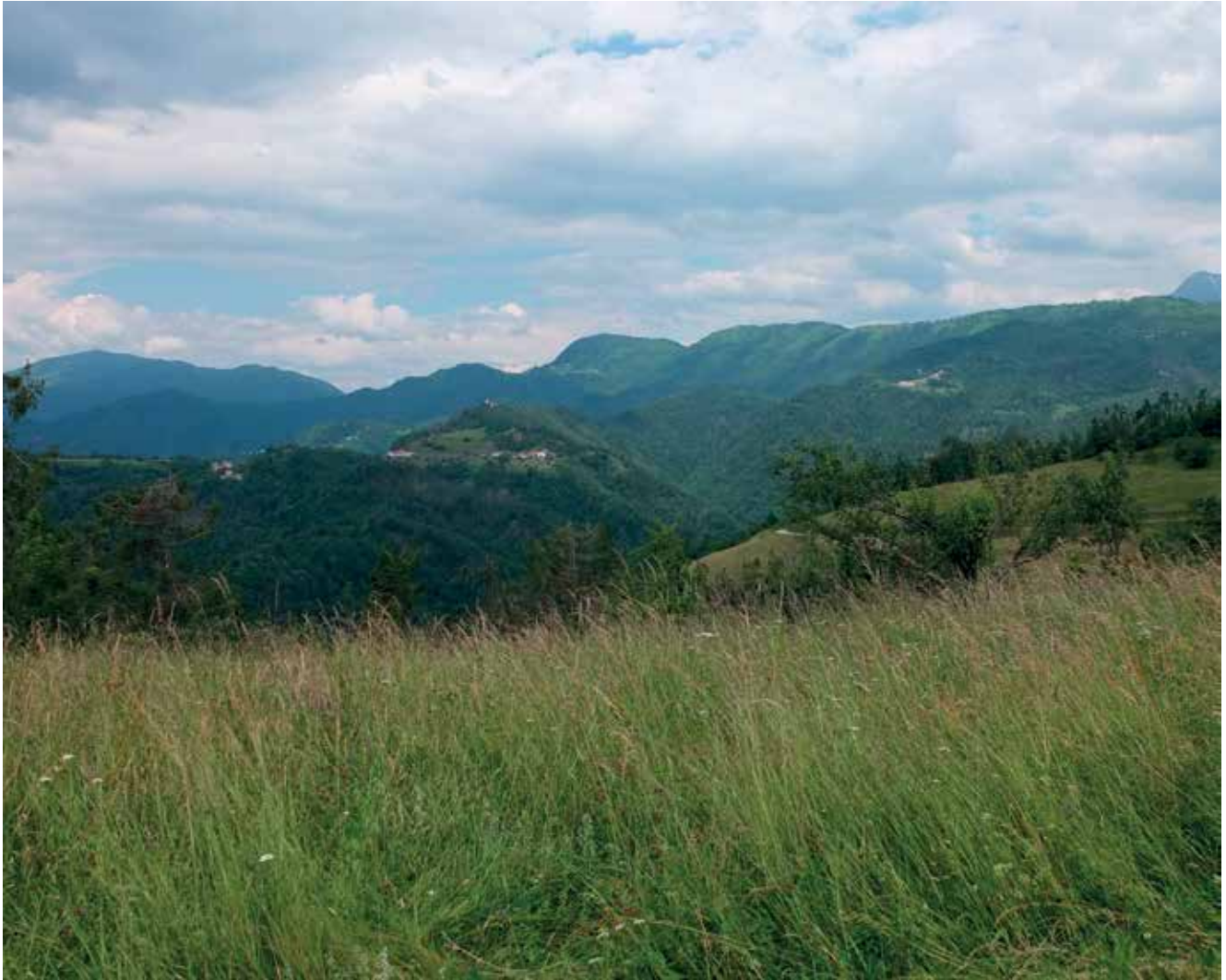
Slika 4: Pogled s Kambreškega na Matajur (levo), ob njem Kuk in Kolovrat.

Kolovrat je gotovo v Posočju najprimernejši kraj na prostem za celovitejšo predstavo dogajanja v 1. svetovni vojni na soški fronti, predvsem o 12. soški ofenzivi. Prav na Kolovratu se je dogajala ena ključnih bitk. Muzej na prostem, ki je postavljen na vršnem grebenu Kolovrata (Za gradom) nas seznani s tukajšnjimi dogodki ob koncu oktobra 1917.