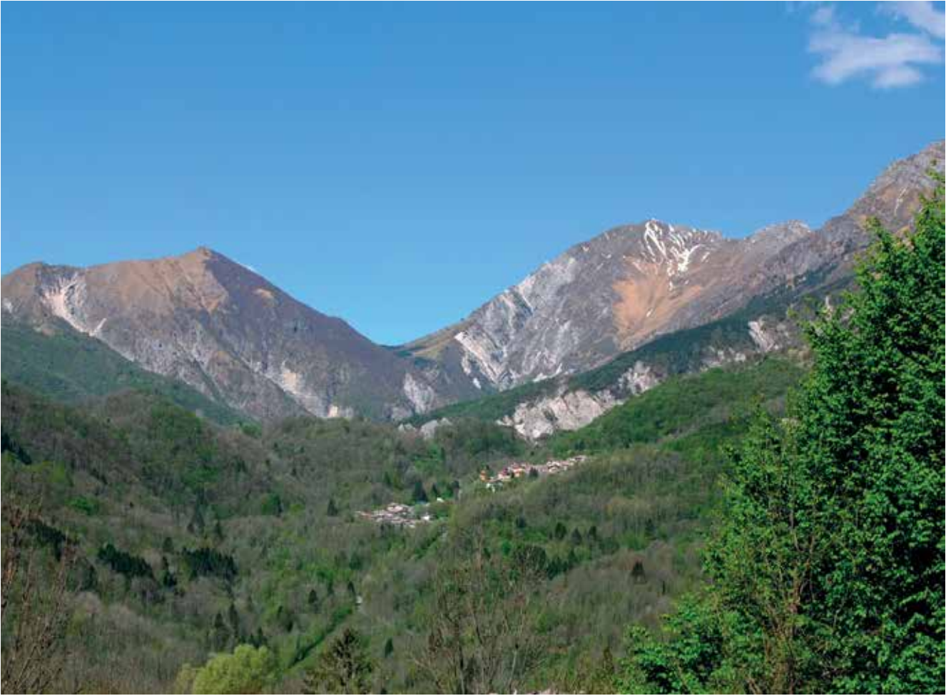
Slika 10: Vasica Podbardo pod grebenom Velikega Karmana, za njim pa je že dolina Tilmenta

Beneška Slovenija je svet, ki je naravno razmejen z gorskimi masivi na severu in z odprtostjo proti jugu. Zato je tukaj nastala naravna meja med Beneško republiko in Habsburško monarhijo, to pa je pomenilo tudi fizično ločitev Beneških Slovencev od pretežnega dela slovenskega naroda, ki je živel v Habsburški monarhiji. Meja sicer ni bila neprodušno zaprta, kar kažejo tudi sorodnosti v kulturi in jeziku z Breginjem, seveda pa je bil pretežni del gospodarstva Beneških Slovencev navezan na jug, v Furlansko nižino. Vzrok za to je bila tudi slaba prometna povezanost med vasmi v strmih pobočjih, ki jih ločujejo globoke doline. Ta svet je tudi reliefno manj primeren za kmetijsko rabo, zato je bilo življenje beneških kmetičev trdo.