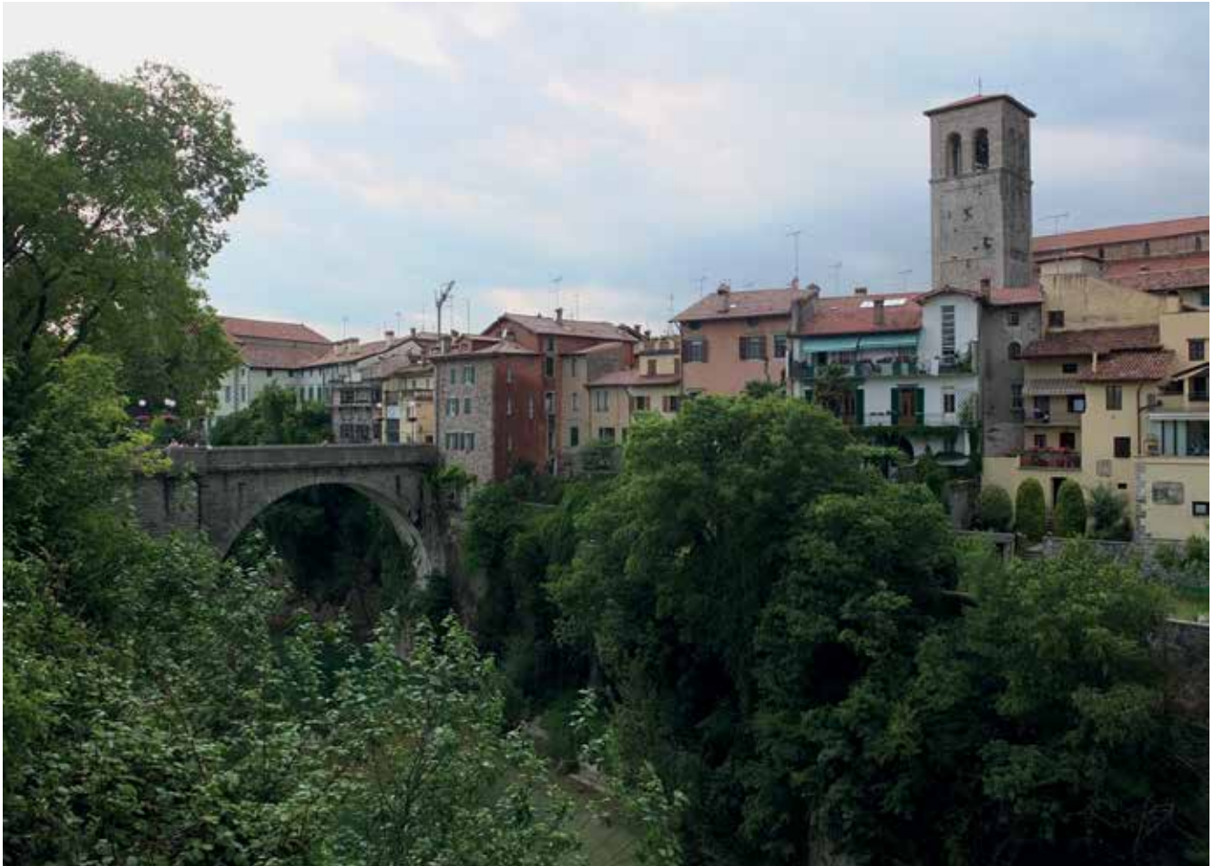
Slika 8: Čedad največkrat slikajo s slikovitim Hudičevim mostom, ki se pne nad konglomeratnimi koriti Nadiže.

Čeprav langobardski, je Čedad danes tudi središče Beneških Slovencev, ki imajo tukaj več slovenskih organizacij: časopis Novi Matajur, Svet slovenskih organizacij, Slovenci po svetu in druge.