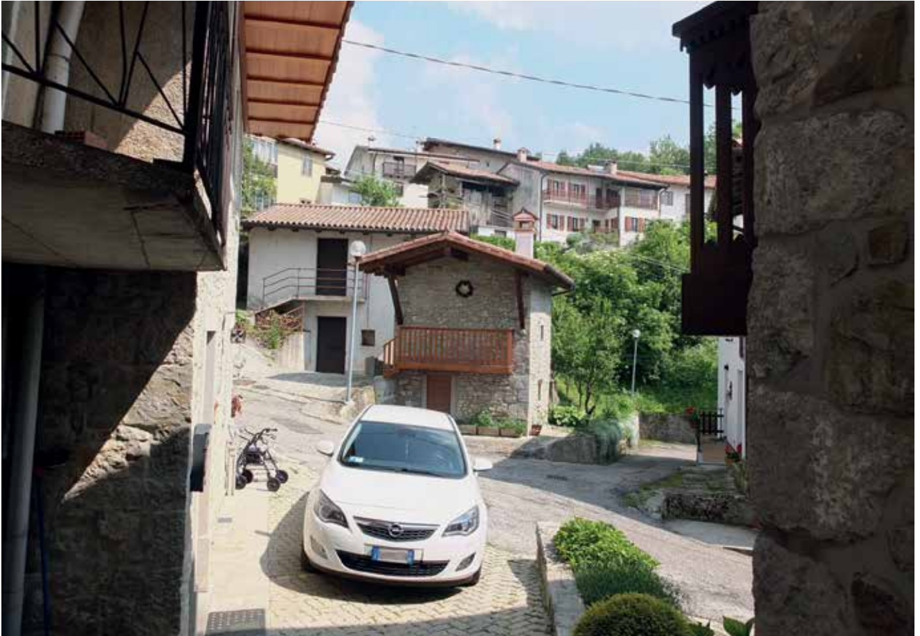
Slika 5: Vas Gorenji Tarbij v vzhodni Benečiji nad dolino Idrije. (Prosim, zamegliti registrsko tablico na avtomobilu)

BENEŠKA SLOVENIJA obsega hriboviti svet nad Furlansko nižino, med dolino Idrije na vzhodu in dolino Tilmenta na zahodu. Geografsko jo delimo na tri enote: