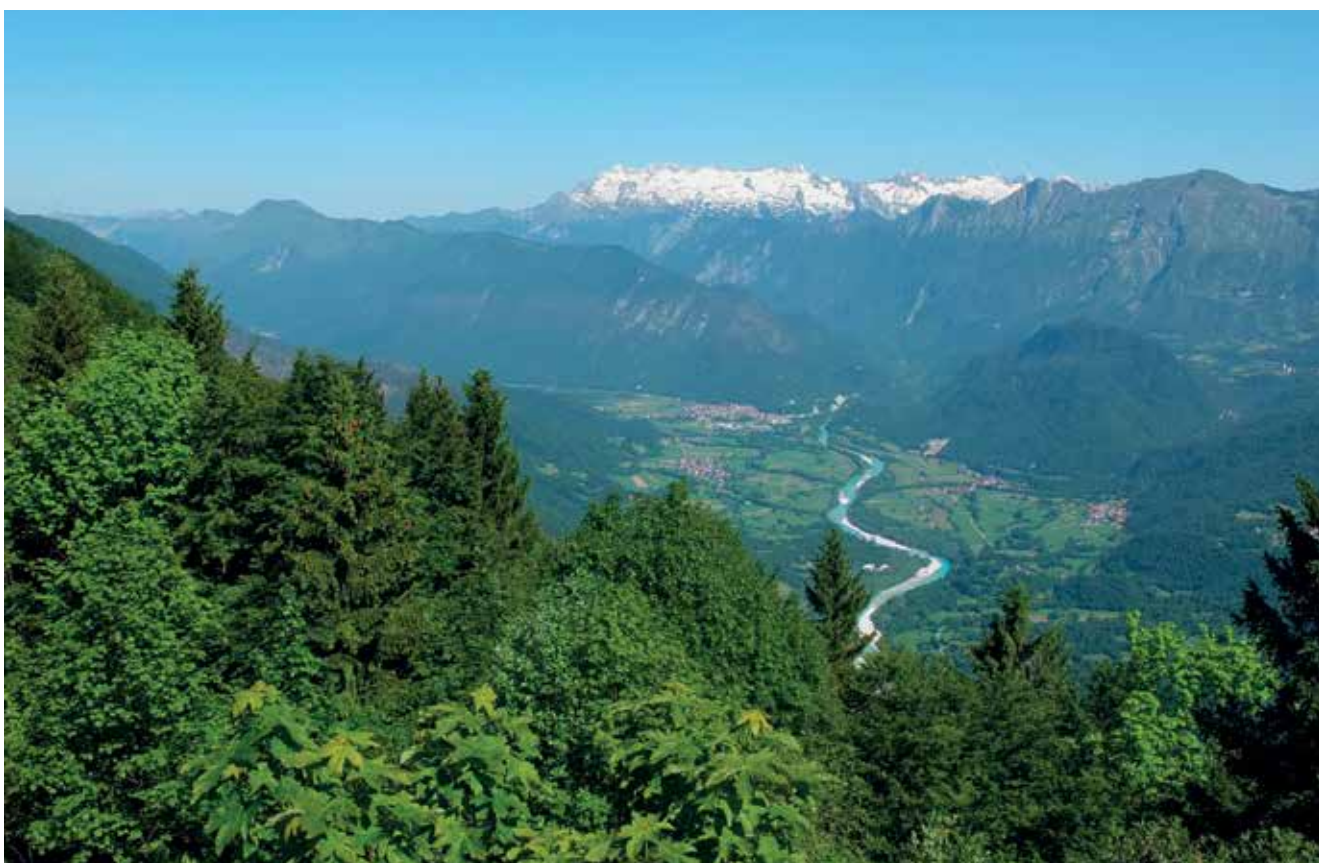
Slika 3: Soška dolina, Kobarid, nad njim Breginjski Stol, Kanin.