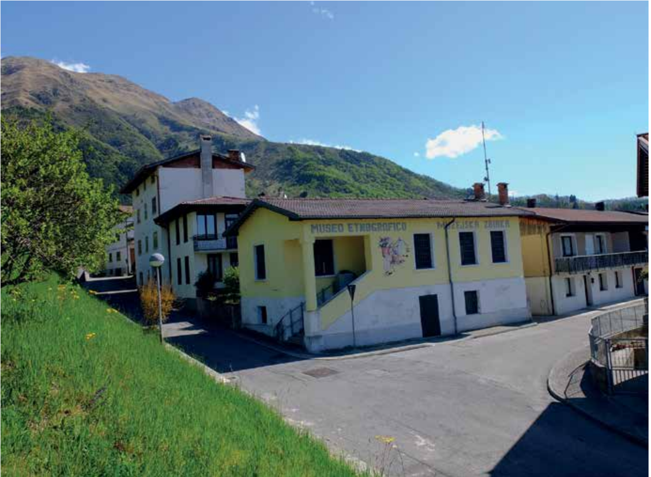
Slika 11: Etnografski muzej v Bardu so postavili v nekdanji vaški mlekarni.

Terskim Slovencem je šele zakon iz leta 2001 priznal status slovenske manjšine, pred tem pa so bili izpostavljeni različnim procesom (in pritiskom), ki so vodili k izginjanju s tega prostora in občutku, da so od vseh pozabljeni. V približno 30 vaseh in zaselkih, ki so posejani po sončnih terasah nad dolinami, prebiva okoli 3000 ljudi slovenskega rodu. Živijo deloma od svoje zemlje in gozda, deloma pa od služb v bližnjih furlanskih mestih.