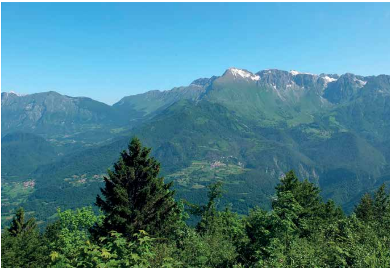
Slika 2: Krn, pod njim vas Vrsno, na levi Drežnica.