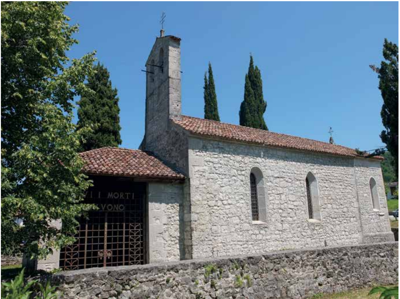
Slika 6: Cerkev sv. Kvirina v Škurinu. Cerkev sv. Kvirina je za Beneške Slovence zgodovinsko pomembna. V času Beneške republike so se tu sestajali prebivalci Nadiških dolin, ki so »na sosednjih« uresničevali lokalno samoupravo. Habsburžani so jim to samoupravo ukinili, v spomin na tradicijo pa se še danes tu enkrat letno zberejo prebivalci iz vzhodnega dela Benečije s prapori. Cerkev je zanimiva tudi zato, ker jo je leta 1493 postavil stavbenik Petrič iz Škofje Loke, o čemer govori napis v gotici na kamniti plošči na vogalu cerkve.

mi“ narodi“. Beneški senat je Slovincem zagrozil, da „ne smejo nikogar pustiti čez te prehode, zlasti v času kuge zavrniti vsakega, naj ima zdravniško spričevalo ali ne, ki bo prihajal iz Koroške, Kranjske, iz Štajerske, Dunaja, Avstrije sploh, iz Ogrske in Poljske“. Slovenci so to službo vestno opravljali, za vso dolgo mejno črto pa so potrebovali le 200 mož, ki so na stražo prihajali vsak dan. Beneška Slovenija tako ni bila dolžna Beneški republiki dajati vojakov in niti ne davkov ali kakih drugih dajatev. Slovenci so imeli sami v rokah sodno in upravno oblast. Poleg tega so bili tudi oproščeni carine, cestnine za živali, kot tudi davščin. Ko je po propadu Beneške republike to ozemlje prišlo pod Avstrijo, so to službo in privilegije izgubili, zato so Beneški Slovenci leta 1866 ob nastanku Kraljevine Italije glasovali zanjo v upanju, da se jim bo njihov avtonomni status povrnil, kar pa se seveda ni zgodilo, še več, italijanska država je že tedaj začela z ukrepi italijanizacije Slovencev, v času fašizma pa je ta politika postala neznosna. Ta politika se je nadaljevala tudi v času po drugi svetovni vojni.