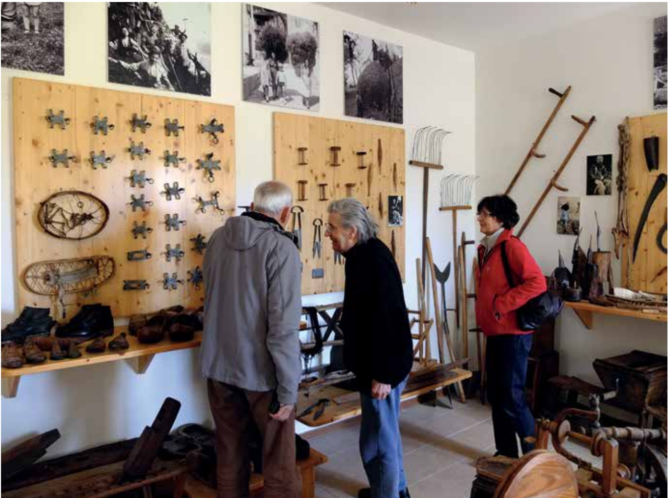
Slika 12: Orodja in predmeti v etnografskem muzeju povedo, da so Terski Slovenci pripadali slovenski kulturi.

nazadovanje pa se je za Beneške Slovence začelo s prihodom fašizma, ki si je prizadeval za popolno asimilacijo Slovencev. Vzel jim je osnovne narodnostne pravice, uporabo slovenskega jezika in pravico do šolanja v maternem jeziku. Sicer so tukaj že veliko let pred fašizmom govorili: ‘Questi slavi bisogna eliminarli’ (Te Slované je treba iztrebiti). Slovenski jezik so hoteli povsem izkoreniniti z uvajanjem otrok v vrtce, kjer se je govorilo izključno italijansko, slovenščino so prepovedali tudi v Cerkvi. Bevkov Kaplan Martin Čedermac je simbol boja Slovencev v Benečiji za materni jezik.