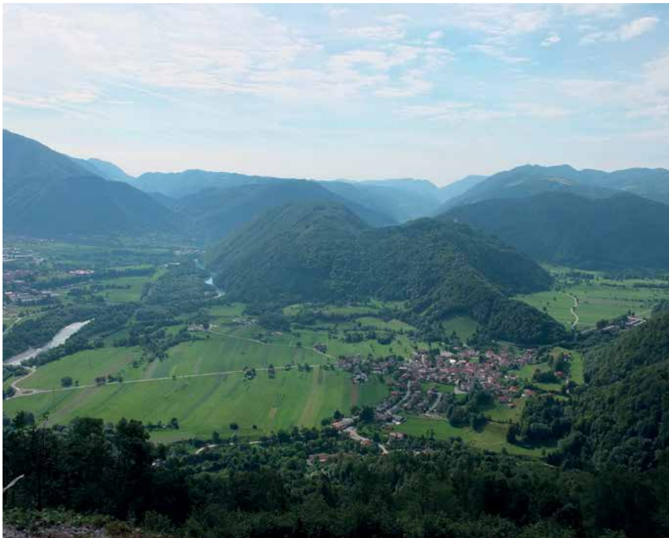
Slika 1: Volče v Tolminski kotlini, zadaj Banjšice in Čepovan.

Vzpon na Kolovrat (1) obiskovalca po 10 kilometrih dobre ceste in 800 metrih višinske razlike nagradi z odličnimi razgledi na vzhod (a) proti Tolminski kotlini in v ozadju Čepovanu in Banjšicam, na sever (b) proti Krnu in njegovim sosedom, na zahod (c) v Soško dolino proti Kobaridu in proti grebenu Breginjskega Stola, na jug (č) pa proti vzhodni Benečiji, dolini Idrije in Kambreškemu.