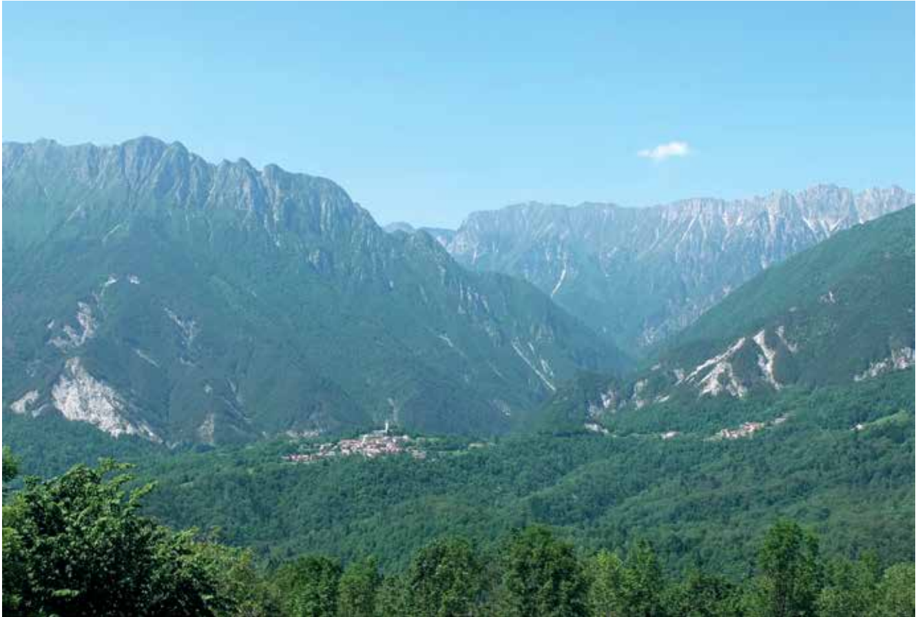
Slika 9: Pogled z Zavarha proti Bardu in soteski Tera v grebenu, ki teče od Breginja do V. Karmana. Tersko dolino na severu zapira greben Muzcev.

Podnebje v Terski dolini je tipično submediteransko, s povprečno januarsko temperaturo +2 °C, v juliju pa +20 °C. Padavin je okoli 1300 mm (velja za kraj Bardo), največ v juniju in najmanj v februarju. Veliko več padavin pa pade na Muzcih, ki so izrazita orografska pregrada za vlažen zrak z juga. Tu so izmerili tudi že več kot 6000 mm padavin.