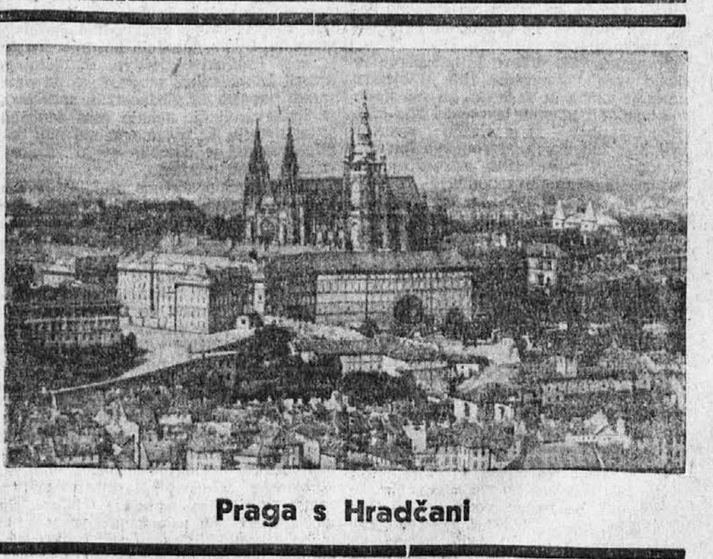
Praga s Hradčani

SOTRUDNIKE IN DOPISNIKE prosimo, da pošleto svoje prispevke najkasneje do vsake srede v tednu.