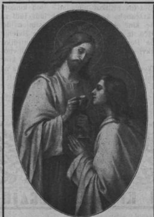
Najvekši kinč katoličanca je: Jezuš v oltarskom svestvi, to je sv. meša i sv. prečiščavanje.

Teško je življenje dnesden. Ljudje se tožijo, da njim slabo ide. Vsemogoče nevole nas terejo. Skoro vseširom čujemo reč krizo. Ta reč pa ne pomeni samo, da nemremo svojega blaga odati i moramo drago kúpivati, nego pomeni tudi krizo vere, tiste žive i prave krščanske vere, štera nas okrepi, da premagamo največše težkoče i živemo srečno v zavúpanji v Boga. Poglednimo si, v čem se pozna ta verska kriza. Ne nam trbe daleč iti, da jo spoznamo. Med seov samimi vidimo, kakše nezavúpanje je med nami i celo sovražtvo človeka do človeka, brata do brata. To nasprot-