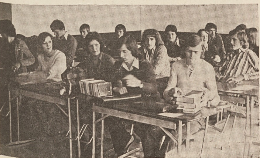
Prvi maturanti v novem poslopiju