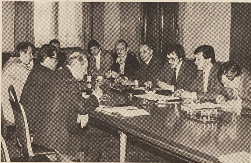
Razgovori v klubu poslancev SPÖ