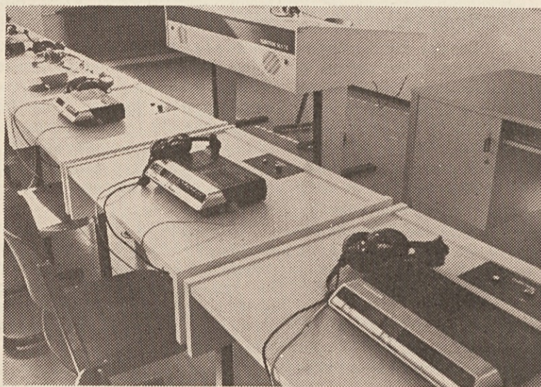
Moderna oprema Slovenske gimnazije: dvorana za fonotipijo.

Seveda je obiskovanje Slovenske gimnazije povezano s finančnimi težavami. Študenti-