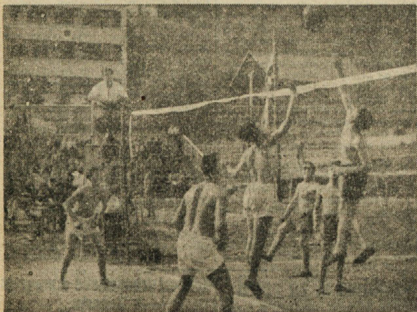
Moment iz tekme Enotnost : Elan