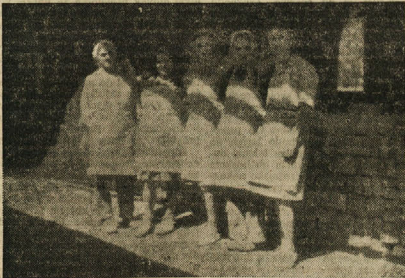
Ob prostem času

ljem opravljajo, kar velja pa tudi za ostale pri vozičkih in pri delu pri peči. Člani pododbora imajo tudi svojo sindikalno knjižnico, naročeni so na Delavsko enotnost, Zasavskega udarnika in na druge časopise, katerega prav radi preberejo. Stenčas, ki je bil vseskozi eden najboljših, ni več na tisti višini. Na skupnih sestankih predesajo naloge in na podlagi zaključkov odpravljajo napake. Kolektiv opekarne hoče s trdnostjo izvršiti vse naloge, ki se pred njega postavljajo.