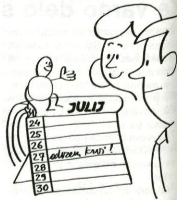
VIDIM, DA NISTA POZABILA