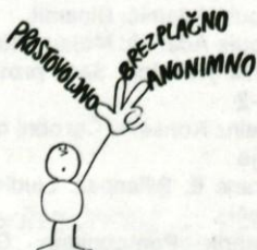
Krvodajalstvo — družbena vrednota