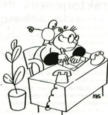
Tudi vi danjste lri, saj menda ni modra?