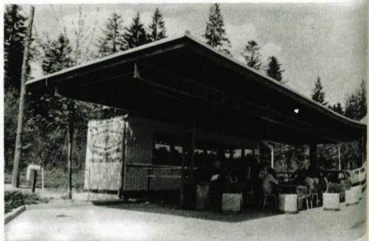
Motel Lom je pričakal prvomajske goste tudi z na novo postavljenim omizjem pred vrtno točilnico.