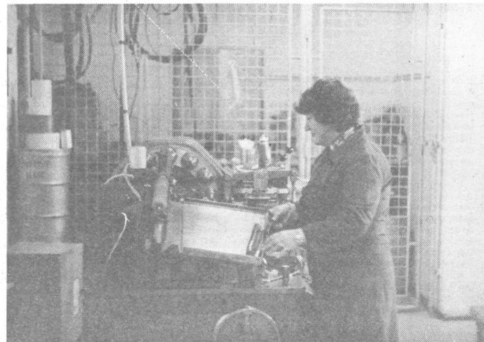
Kljub temu da so tudi lani delali v TOZD Zapiralna embalaža v težkih prostorskih pogojih, so povečali fizično produktivnost skoraj za 20 odstotkov