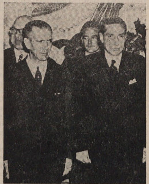
Novi argentinski državni predsednik general Lonardi (levo) v spremstvu svojega zunanjega ministra.