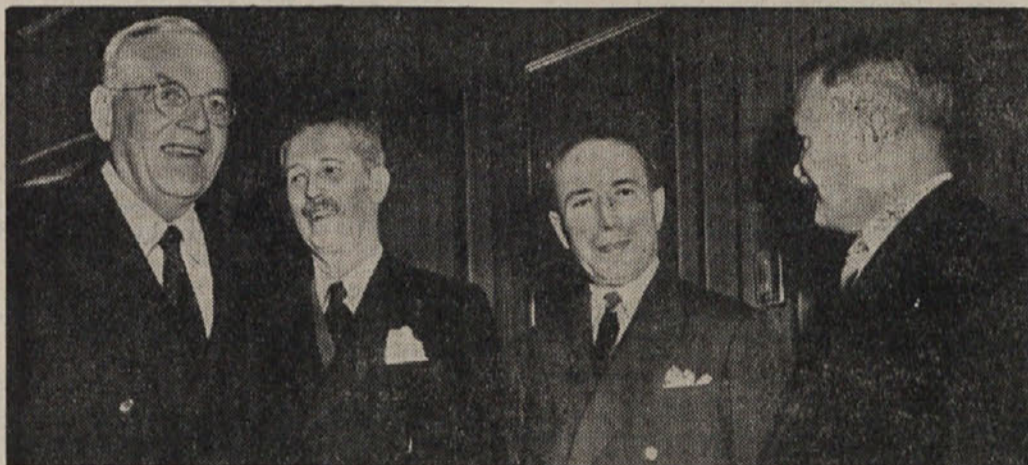
Konec oktobra se bodo v Ženevi znova sestali zunanji ministri „štirih velesil“. Na sliki so: Foster Dulles (USA) Mc Millan (Anglija), Pinay (Francija) in Molotov (Sovjetska zveza) kot jih je fotograf „pritisnil“ ob priliki zasedanja Združenih narodov v New Yorku. Ali se bodo tudi v Ženevi tako suncjali?

Nadškofovo geslo: „Služiti v ljubezni“ označuje njegovo naravo in njegovo delo.