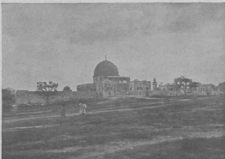
Omarjeva mošeja z bližnjimi poslopji.

Vrhu griča je dokaj velika, obzidana ravnina. Sredi nje stoji — prav na mestu Salomonovega templja — zdaj turška molilnica, Omarjeva mošeja. Sezuti smo si morali obuvala, preden smo smeli vstopiti v to prelepo stavbo z veličastno kupolo. V svoje molilnice hodijo namreč Turki bosí, toda s pokrito glavo; ravno narobe kot mi katoličani v svoje cerkve. Nekaj posebnega je v Omarjevi mošiji velika naravna, živa skala, na sredi, kroginkrog ograjena. To je vrh gore Morije, kjer je — po izročilu — hotel darovati Abraham svojega sina Izaka; kraj, kjer je stal v Salomonovem templju darilni oltar. Ko sem stopal po tem turškem svetišču, stopile so mi živo pred oči zgodbe, ki so se vršile na tem svetem kraju. V duhu sem gledal Marijo, ki je prinesla dete Jezusa darovat na ta kraj, in poslušal sem govoriti starčka Simeona, z božjim Detetom v naročju: „Zdaj spustiš svojega služabnika,