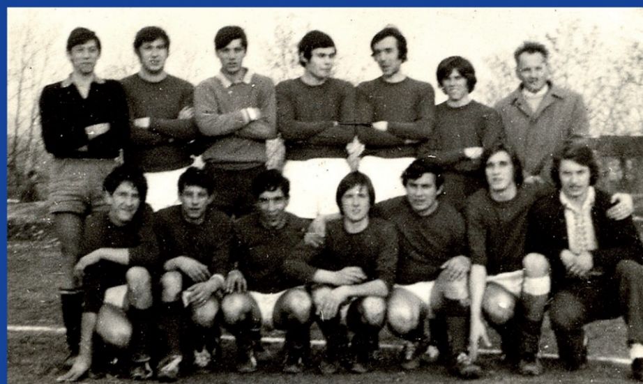
VALNATISONE 1970-71 promossa in 2. categoria