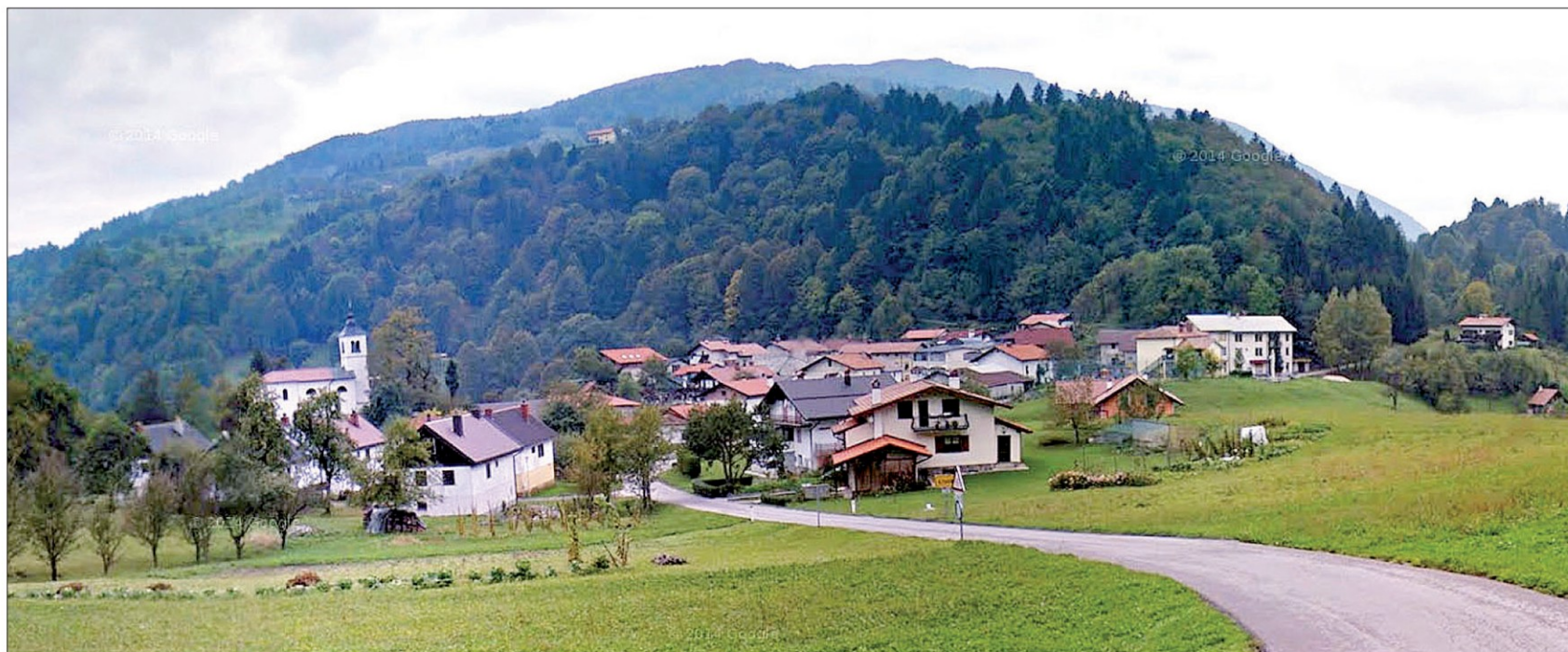
Livek šteje 257 prebivalcev, v zadnjih treh letih so se livške družine pomnožile za 20 otrok

Osrednji dogodek praznovanja livškega zavetnika Svetega Jakoba je bil ogled prenovljenega poslopja šole na Livku. Praznovanje je bilo široko zasnovano. Športno društvo Livek je pripravilo dvodnevni turnir v malem nogometu, srečelov in glasbeni večer, krajevna skupnost pa je obnovljeno šolo spremenila v veliko razstavišče. Na predvečer praznika je Livčane obiskalo gledališče iz Kambreškega, na praznični dan pa je na obisk prišlo veliko izseljenih Livčanov. Srečanje vaščanov z Livčani, ki živijo drugje, naj bi postalo tradicionalno.