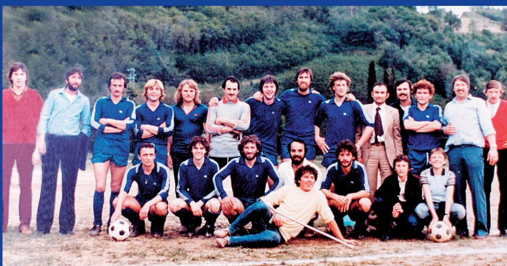
VALNATISONE 1980-81 promossa in Eccellenza