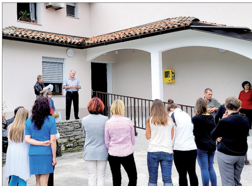
Utrinki s praznovanja Svetega Jakoba