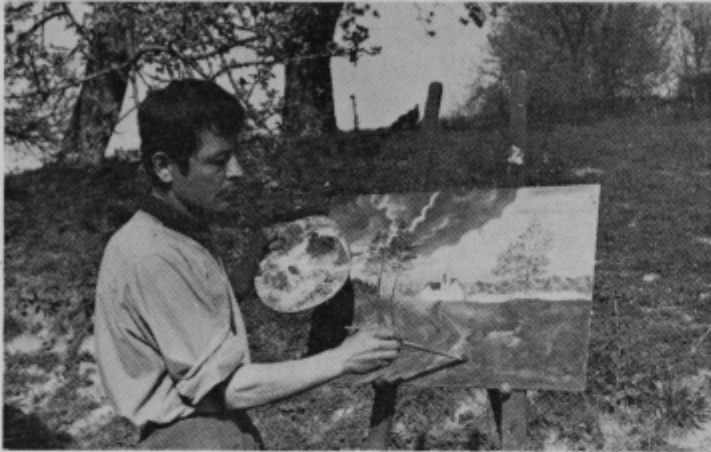
Še nekaj potez in slika bo gotova