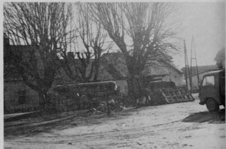
Samo deset metrov od središča mesta Slov. Bistrica. Tudi letošnja akcija za čisto okolje tega „tihužnja“ ni zmotila.

akcije za čisto okolje občani ne morejo brez negotovanja. Z mnogimi primeri se celo vsakodnevno srečujejo, na poti na delo, trgovino