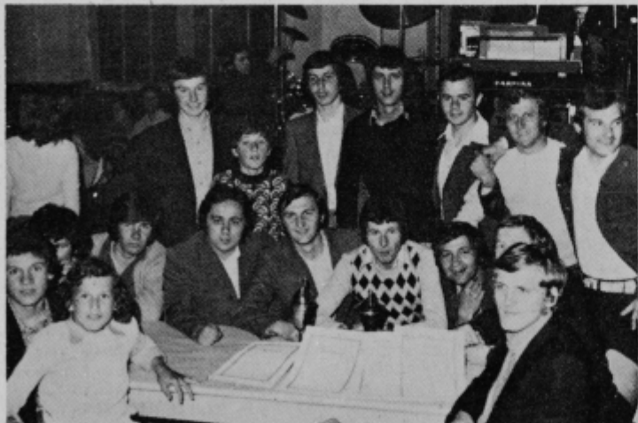
Središki mladinci s svojimi letošnjimi „trofejami“.