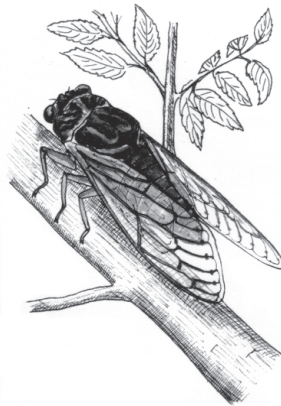
Cicada orni L.

Pridi, moj škržadek: tesno me objemi, sredi žarnega poletja sladko vkup zgoriva!«