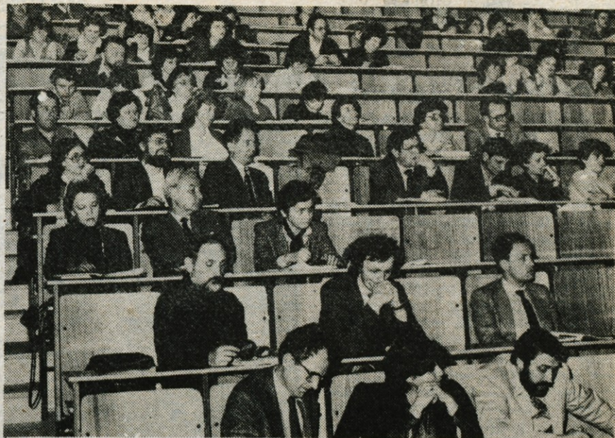
Družbenopolitična gradiva in časopisno besedilo — Centër za družbenopolitično izobraževanje pri Fakulteti za sociologijo, politične vede in novinarstvo iz Ljubljane je minuli četrtek in petek pripravil v Škofji Loki seminar s posvetovaljem na temo družbenopolitična gradiva in časopisnih besedil. Pritegnil je veliko pozornosti, saj je bila vsebina seminarja aktualna, nanašala se je na jezikovne odseve birokratskih odnosov v samoupravni družbi.