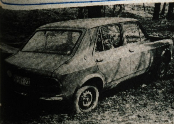
Blejski »cvetki« pred poletno sezono — Lastnika sta kdovekdaj že pozabila nanju, drugi se zanju ne zmenijo. Tako uboga jeklena konjička čakata, da se bosta sesedla in ju bo morda le kdo odpeljal med staro šaro. Zapuščena siromaka smo našli sredi turističnega Bleda, pod hotelom Jelovica in tik ob avtobusni postaji. Bosta »cvetki« krasi Bled vse poletje? (MV)