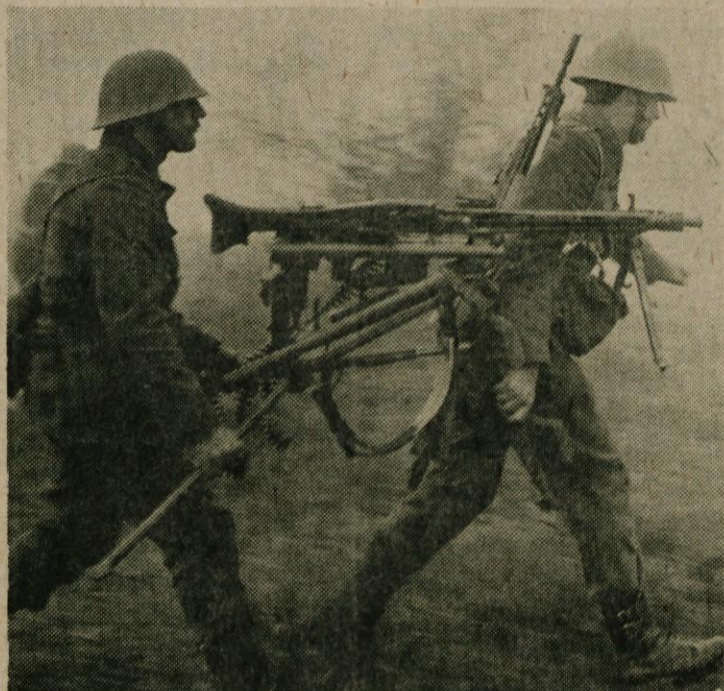
„Plava“ sta se v diru spustila v napad . . .