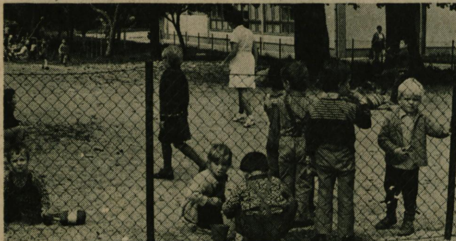
S spomladansko odločitvijo na referendumu smo se odločno zavzeli za korenito ureditev sedanjih razmer varstva otrok v naši občini. V nekaj letih bomo imeli naše malčke že v novem vzgojnovarstvenem domu v Logatcu in v urejenih prostorih v Rovtah in Hotedršici.