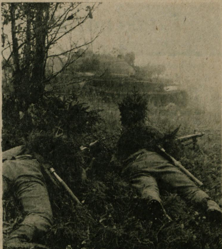
. . . nedaleč pa sta ju v zasedi, skrita v vejevju, tiho pričakala „rdeča“