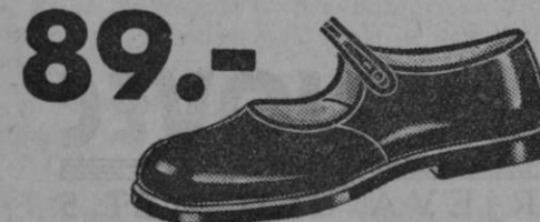
št. 35-38 Vrsta 5844-05 Dekliški fleksibilne čevlček iz laka, usnjena peta. Neobhodno potreben za nedeljo in praznik.