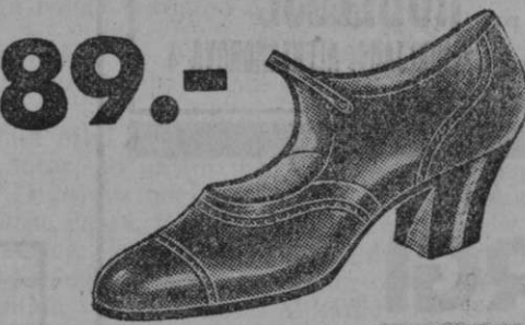
89.- Vrsta 2945-11 Čevlji iz rjavega boksa. — Praktični in elegantni. Ravno taki iz laka za nedeljo in praznik po ceni Din 99.—