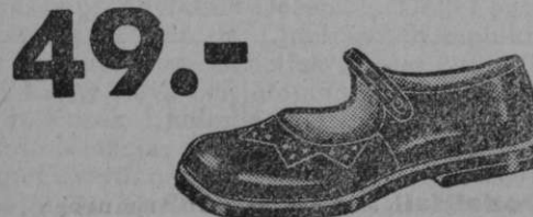
št. 20-26 Vrsta 5851-30 Za ljubljence lakaste ali rjave kombinirane čevlčke. Zelo lepi in okusni.