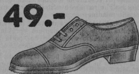
49.- Vrsta 3335-10 Ženski sivi platneni nizki čevlji z gumijastim podplatom. Za lepe sončne dneve.