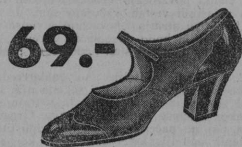
69.- Vrsta 1845-52 Ti čevlčki iz finega baržuna, kombinirani z lakom, zamorejo zadovoljiti še tako fin okus in nadomestiti čevlje iz jelenje kože.