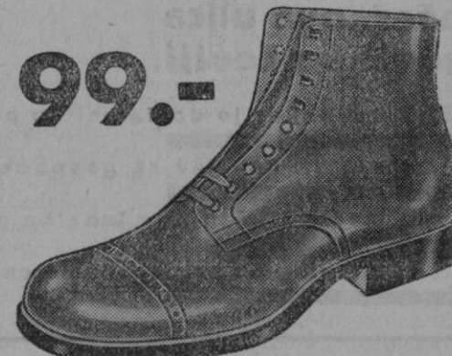
99.- Vrsta 3967-22 Iz močnega boksa, široka in udobna oblika, močni gumijasti podplati. Prav posebno trpežni čevlji.