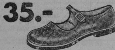
Vrsta 2942-00 Otroška sandala z usnjanim podplatom samo Din 35.—. Jamčimo za vsak par. — Moške Din 49.—