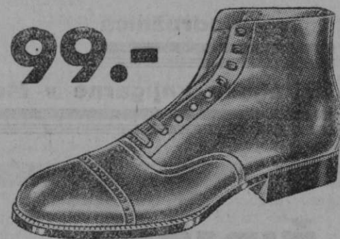
99.- Vrsta 1977-22 Visoki čevlji iz finega črnega telečjega boksa z elastičnim gumijastim podplatom. Odlični za vse one, ki polagajo posebno važnost na trajnost obutve.