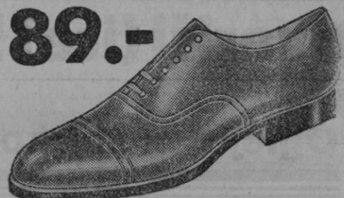
89.- Vrsta 1937-29 Iz močnega boksa z elastičnim gumijastim podplatom. Za dnevno uporabo, rjavi ali črni.