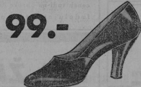
99.- Vrsta 9805-07 Pumps-čevlček iz rjavega boksa ali laka. Enostaven, toda vendar vedno moderen in eleganten čevl.