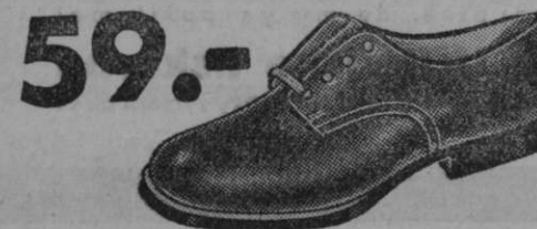
št. 27-34 Vrsta 3922-00 Iz boksa za nemirne dečke. Močni podplati iz krupona, zelo trpežni čevlji. Št. 35-38 Din 69.—