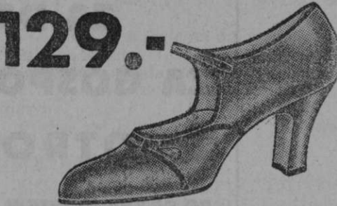
129.- Vrsta 9675-38 Eleganten čevlček iz rjavega boksa ali črnega laka s kombinacijo kačje kože.