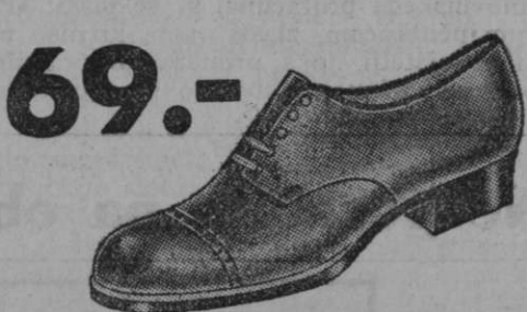
69.- Vrsta 3925-03 Močni čevlji iz črnega boksa s čvrstim gumijastim podplatom. Za štrapač in vsakdanjo uporabo.