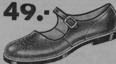
49.- Vrsta 2947 Za lepe sončne dneve Vam je vsekakor potrebna ta lahka in udobna sandala z usnjanim podplatom.