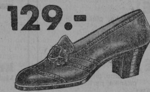
129.- Vrsta 2605-16 Okusen čevlček k sportnemu kostimu. Izdelan iz temnorjavega boksa.