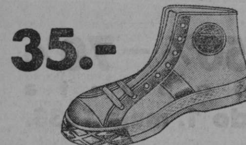
Vrsta 4562-29 Za sport. Idealen in najcenejši čevl za vse panoge sporta, za turizem in za razne igre.