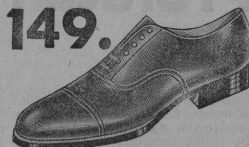
149.- Vrsta 1637-21 Iz prvovrstnega telečjega rjavega ali črnega boksa. Lakasti za isto ceno. Zelo praktični in udobni čevlji.