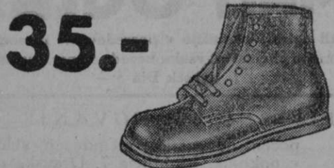
št. 19-27 Vrsta 3661-00 Otročičkom lepe pomladanske visoke čevlčke iz rjavega boksa s podplatom iz krupona.