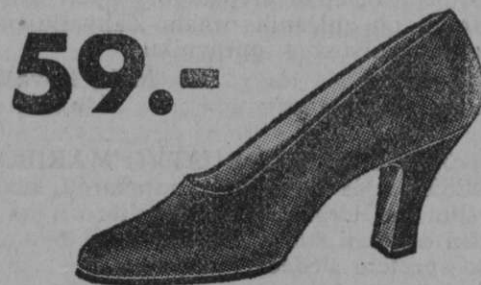
59.- Vrsta 9375-03 Lahek in eleganten čevlček iz satena z visoko, okusno peto.