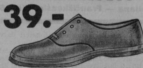
39.- Vrsta 4538-00 V pomladanskih dneh najudobnejši čevl za lahko hojo. Iz sivoga platna z gumijastim podplatom.