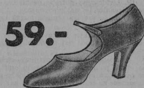
59.- Vrsta 9815-03 Okusen dekolte-čevlček iz finega baržuna ali satena. Ne sme manjkati v garderobi nobene praktične dame.