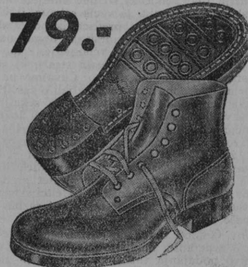
79.- Vrsta 0167-00 Čizme iz mastnega usnja z močnim vulkaniziranim gumijastim podplatom. Prikladne za delo na polju, zgradbah, cestah in za vsak drug štrapač.