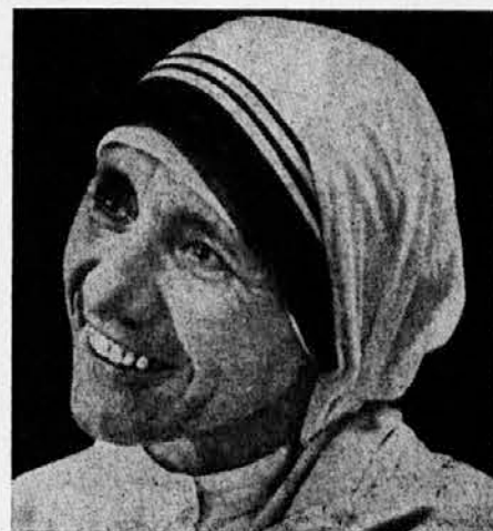
Misijonarka m. Terezija

V Indiji je misijonski Kristusov program dobil zlasti v Kalkuti pričevalca, ki je vest sedanje družbe. Ta pričevalec je m. Terezija, ki nudi vsemu svetu vzpodbuden pouk o ljubezni in sočutju do bližnjega. Njeno ravnanje je izziv svetu, ki je poln egoizma, uživanja, željan moči, denarja in vpliva. Nasproti temu ta pričevalka ne z besedami, ampak dejanji oznanja Kristusovo ljubezen, oznanja vsem revežem njegovo sporočilo.