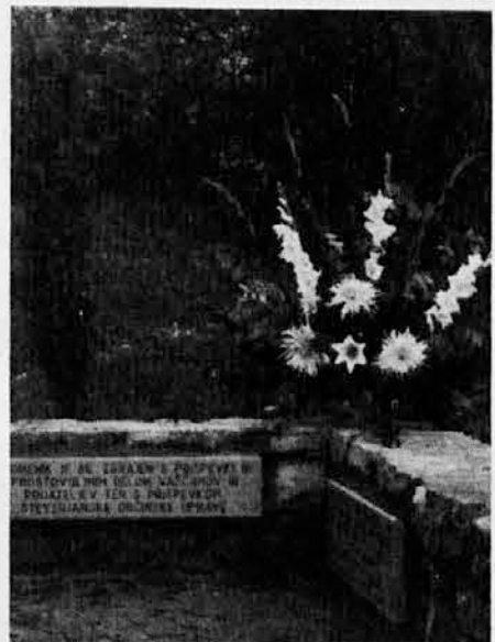
Spomenik padlim borcem na Jazbinah

V bodoče bodo škofje bogoslovce posvečali v diakone že na koncu 5. letnika, mašniška posvečenja pa bodo kot doslej po končanem 6. letniku. Evharistično leto je v teku, pripravljene so že posebne šmarnice in primeren molitvenik. Posebnih slovesnosti v vseslovenskem ali škofijskem merilu sicer ne bo, priporoča pa se, naj se izvedejo po župnijah ali v povezavi več župnij.