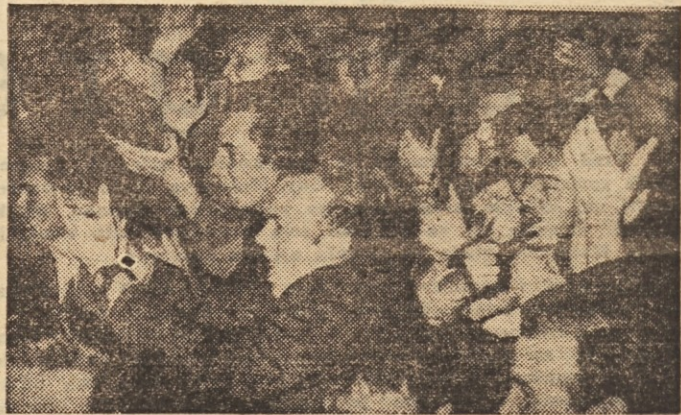
Prebivalci Varšave pozdravljajo Gomulko z vzkliki: »Ni kruha brez svobode!«

Sploh pa je danes še prezgodaj, da bi kaj določenejšega rekli o sindikatih in kakšne oblike bo prevzela delavska samouprava na Madžarskem.