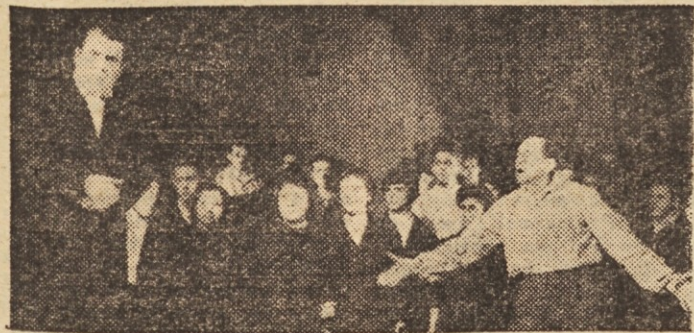
V Domu Svobode v Sentvidu je gledališka skupina Delavskega odra s Cankar-Delakovo »Jernejevo pravico« doživela svoj krst. Z uprizoritvijo so bili gledalci zelo zadovoljni.

Na sliki: notranjščina gotske katedrale v Amiensu, ki je lahkotna in ki jasno kaže težnje gotske arhitekture.