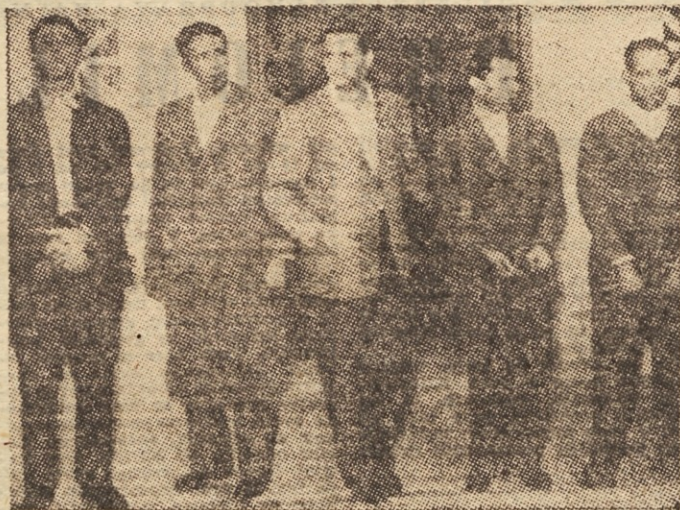
Ujeti alžirski voditelji

Zato je vprašanje: »Kam greš, Francija?« popolnoma upravičeno.