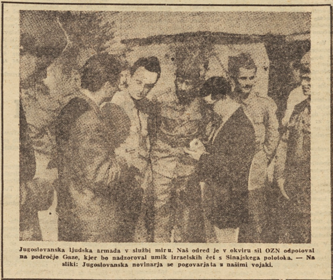
Jugoslovanska ljudska armada v službi miru. Naš odred je v okviru sil OZN odpoval na področje Gaze, kjer bo nadzoroval umik izraelskih čet s Sinajskega polotoka. — Na sliki: Jugoslovanska novinarja se pogovarjata z našimi vojaki.

skorajda nespremenjena. Toda če upoštevamo, da je potrošnja prebivalstva v primerjavi z lanskim letom nazadovala za približno 2,5 odstot. na prebivalca in če upoštevamo, da so se v mestih in industrijskih središčih precej podražili kmetijski pridelki ter da so se istočasno podražili izdelki za gospodinjstvo, kurivo, razne stornitve, da so porasli izdatki za kulturne potrebe, potem je jasno, da so se realne plače delavcev in uslužbencev znižale. Zato ni odveč zahteva, izrečena na plenarnem zasedanju, da bi morali sestavljati plan ne samo s stališča investicij, temveč s stališča, kako, s kakšnimi sredstvi, na kakšen način doseči hitrejšo rast materialne proizvodnje in s tem življenjske ravn. Vprašanje standarda bi morali po tej zahtevi v planu trdneje postaviti — kot enega izmed njegovih proporcev — in stalno nadzorovati gibanje realnih plač. Z rezervami Federacije bi morali preprečiti znižanje življenjskega standarda — zniževanje realnih plač. Zato bi (Nadaljevanje na 3. strani)