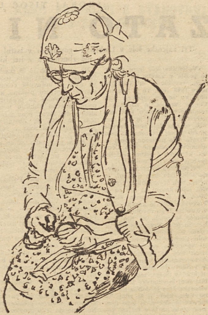
Marjan Dovjak: Pri živanju — perorisba

Na posvetovanju so ugotovili, da je bilo do zdaj premalo stikov in sodelovanja med občino in industrijskimi podjetji. Poudarili so, naj bi taka posvetovanja sklicali še večkrat.