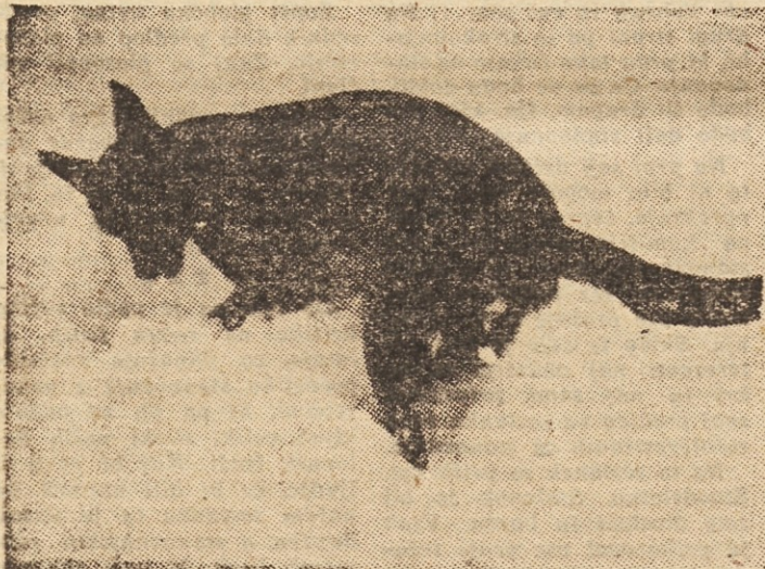
Lavinski pes je najboljši sodelavec gerskih reševalcev

funkcije. Na intervencijo moje bivše pokroviteljice, je bila moja prošnja takoj uslišana. Odsel sem daleč, daleč in stopil v komunalno službo. Zdaj vsaj vem, zakaj me ljudje zmerjajo.