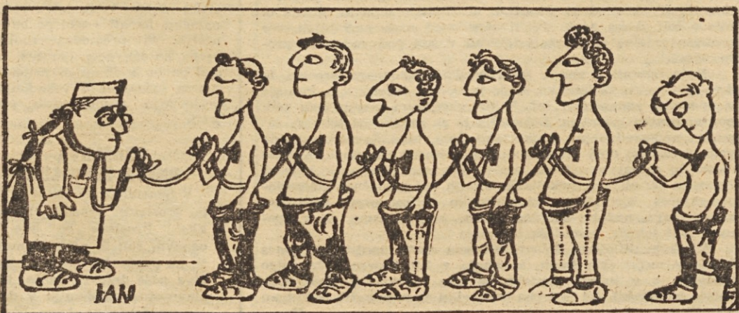
Zdravnik: Torek komu hrešči v prsih? (Češki humor)