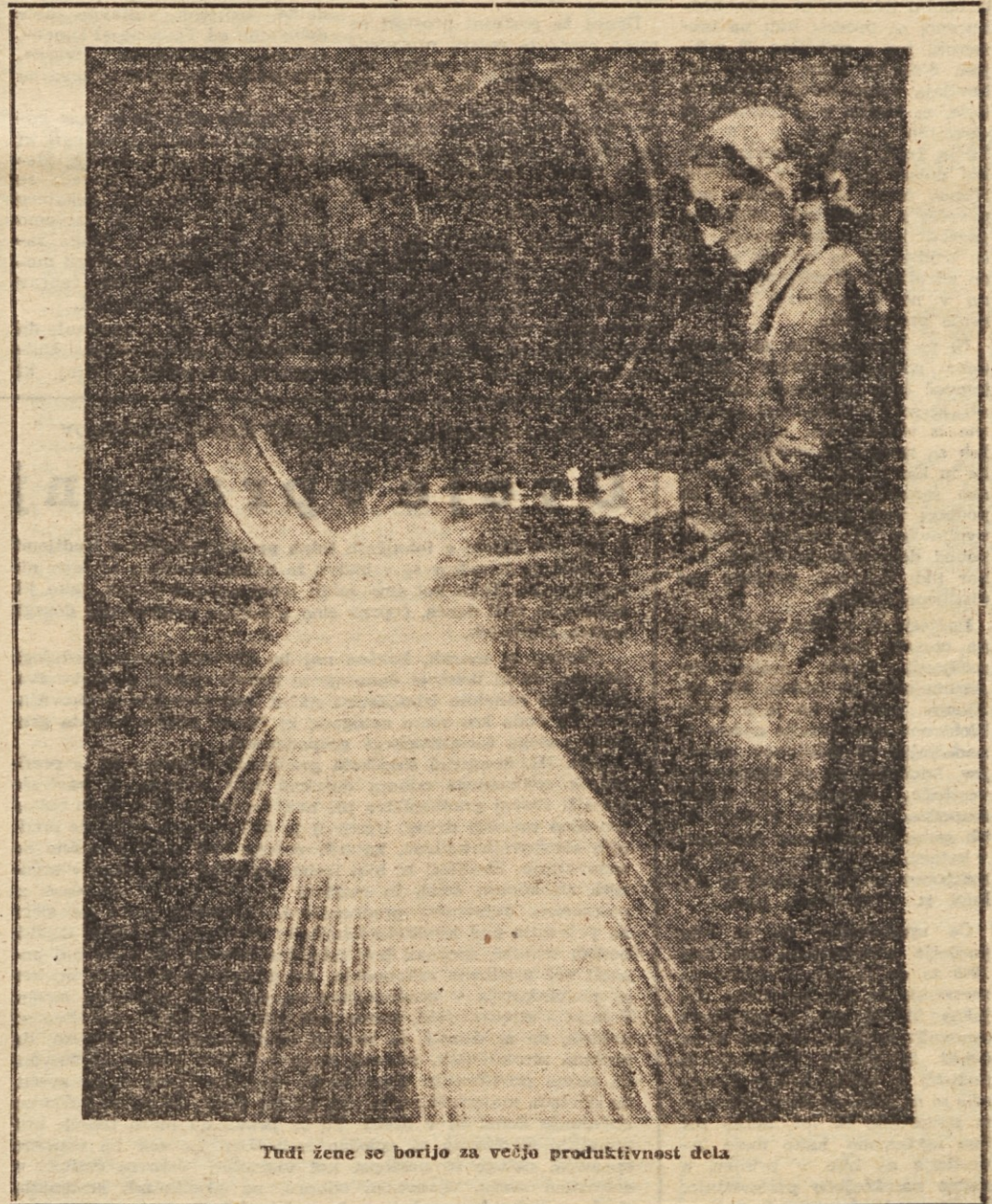
Tudi žene se borijo za večjo produktivnost dela

S teh stališč je bila v razpravi upravičeno izrečena pripomba, da strokovni državni aparat preveč toga brani svoja stališča, da se o tem veliko razpravlja, rezultatov pa ni in da v planu za leto 1957 ni bilo vprašanj produktivnosti posvečeno dovolj pozornosti. To velja posebno za plačni sistem, ki lahko v kratkem času zelo poveča storilnost. In upravičeno je bila izrečena zahteva na plenarnem zasedanju v prvih dneh, da mora Skupščina s svoje strani zahtevati, da se vprašanje plačnega sistema v letu 1957 ne samo do kraja prouči, temveč tudi reši v smislu povezanosti plač z delovno storilnostjo, kajti življenjska raven, plačni sistem in storilnost so med seboj tesno povezane, neločljive stvari.