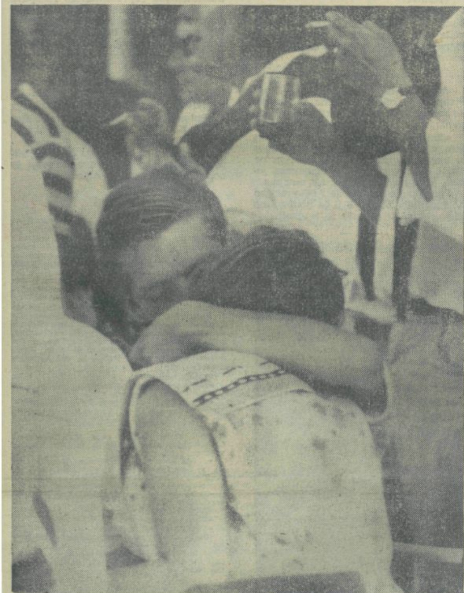
Ne recite preveč besed, ko boste odhajali. Recite eno samo: »Nasvidenje!«