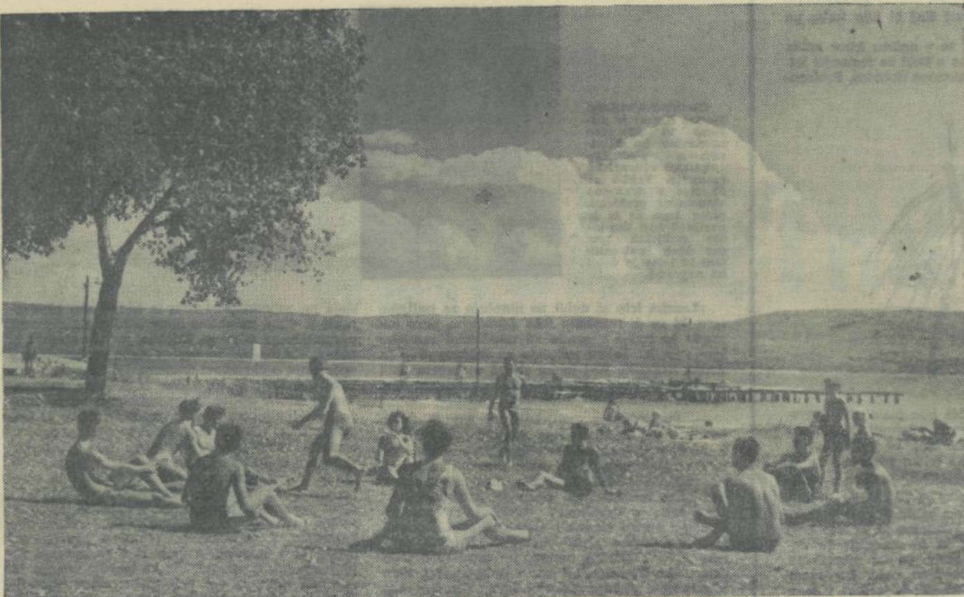
STUDENTJE, OBIŠCITE ANKARAN, NASO STUDENTOVSKO LETOVIŠČE!

Organizacije imajo samo ENO nalogo, da vse te sklepe in priporočila IZVEDEJO