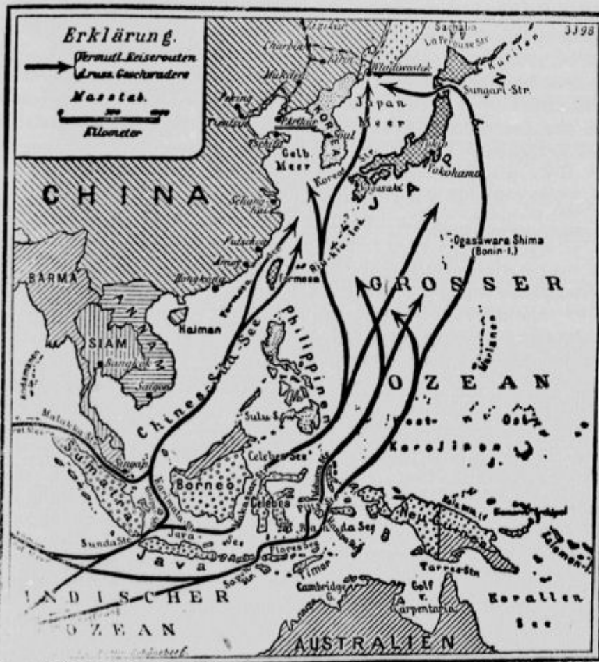
Pot baltškega brodovja.

jev dolg jarek, ga pokrili s slamo in lesom in politi s smolo in oljem; ko so Japonci prišli na ta jarek, so ga Rusi zažgali, in tako je več sto Japoncev čisto gorelo. Ogenj je trajal en dan in eno noč. Posadka v Port Arturju je res hrabra. Japonci so pogubili že čez 60 000 mož zapoljo nje. Poroča se tudi, da so Rusi grič „203 m“ vzeli Japoncem nazaj.