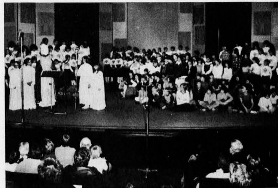
Prihod sv. Miklavža v Kulturnem domu v Trstu, ki je nagradil najboljša literarna in slikarska dela ter podelil spominek vsem otrokom, ki so sodelovali ob Letu otroka