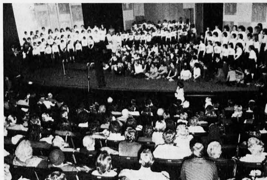
Pogled na nastopajoče otroke ob zaključni prireditvi za mednarodno Leto otroka v nedeljo 9. decembra 1979 v Kulturnem domu v Trstu

Iz pisma diha škofova ljubezen do otroka po evangeljskem reku: Če ne bomo ka-