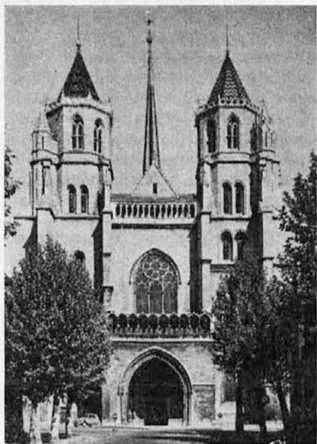
Katedrala Saint-Benigna v Dijonu

V nizu francoskih pokrajin ima Burgundija gotovo svoje čisto posebne značilnosti. Dežela je gričevnata, vsa prepletena z gozdovi in polna obetajočih vinogradov — prave slave te lepe zemlje. Med ostalim pa skriva ta burgundska zemlja veliko drugih biserov in hrani veliko neminljivega in plemeniteba, ki ga tudi burgundec gotovo ne prekaša. Bogata zgodovina, vojvodska slava, meniške tradicije Clunyja in Citeauxa — matice belih menihov cistercijancev, umetniški spomeniki, gotoske ostrine — vse to ji daje popolnoma lasten pečat!