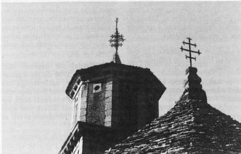
Značilni trikraki križ na zgoniški cerkvi

Zgoniška cerkev potrebuje najprej temeljita zunanja popravila. Prenoviti je treba zvonik, omete, streho, ki razpada in pušča, elek-