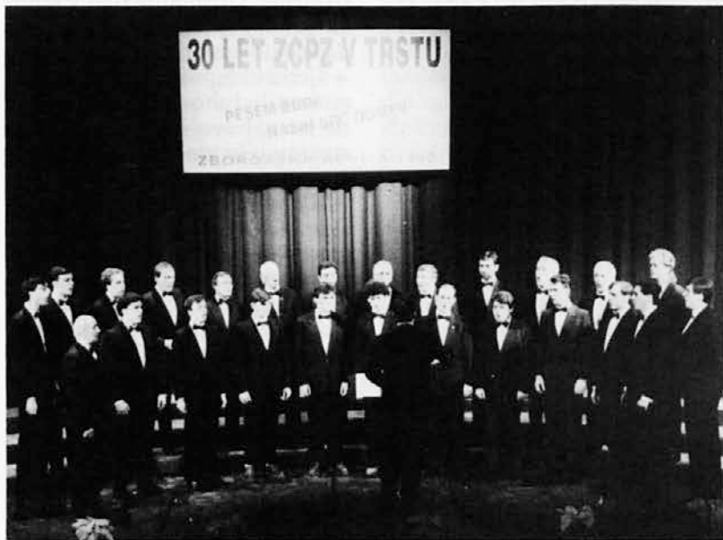
Letošnja revija ZCPZ v Kulturnem domu v Trstu je bila nadvse slovesna