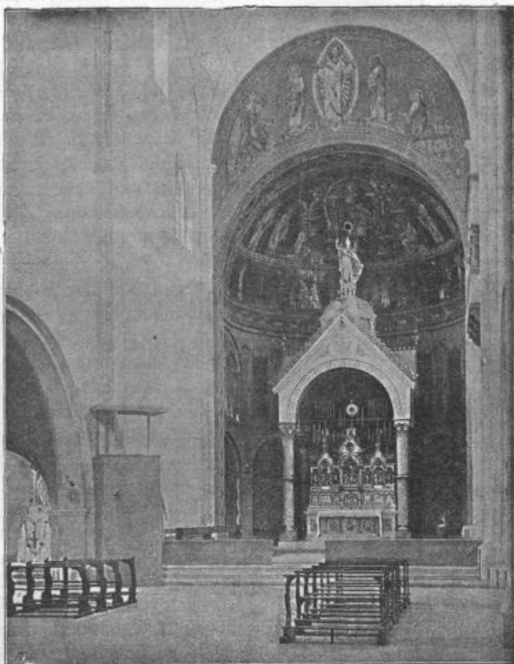
Cerkev vednega češčenja v Bocnu — notranjščina.

Fara p. Kost. belo kazulo; Gorje vezen prt; Golo črno kazulo; Godovič črno kazulo; Gojzd velum; Hotič vijolično kazulo; Sv. Helena velum; Horjul burzo, štolo; Homec bel pluvijal; Ihan belo kazulo; Ig črno kazulo; Javorje n. Šk. L. albo; Javorje p. Litiji koretelj, burzo, spovedno štolo; Idrija Sp.