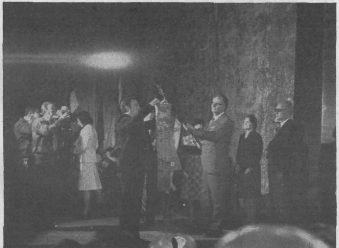
S svečanosti podelitve domicila Varnostno obveščevalni službi.

navedemo le nekaj: italijanska policija, vojaško poveljstvo, vojaška obveščevalna služba, fašistična tajna policija, zopori, vodstvo bele in plave garde in druge. Poleg obveščevalne dejavnosti je VOS opravljala tudi druge naloge, ki so bile potrebne za zaščito in uspeh boja in revolucije. Borila se je