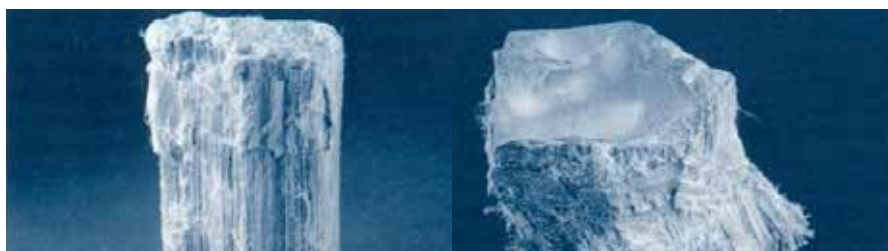
Slika 1: Primerjava strukture krizotilnih in amfibolnih vlaken (Vir: Albracht G., Schwerdtfeger O.A., Herausforderung Asbest, , Universum Verlagsanstalt GmbH KG, Wiesbaden, 1991, str. 14.

Amfibolna vlakna so trdna, ravna vlakna in imajo običajno večji premer kot krizotilna vlakna. Zaradi svoje oblike in strukture ostajajo v človekovem telesu še več desetletij po vdihavanju, zato veljajo za nevarnejša kot krizotilna vlakna. Amfiboli so v primerjavi s krizotilom bolj odporni na kisline in slabše na baze. Najbolj problematična azbestna vlakna so vlakna, katerih dolžina je večja od 5 µm, premer manjši od 3 µm, razmerje med dolžino in premerom pa večje od 3:1.