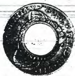
An original 1813 holey dollar