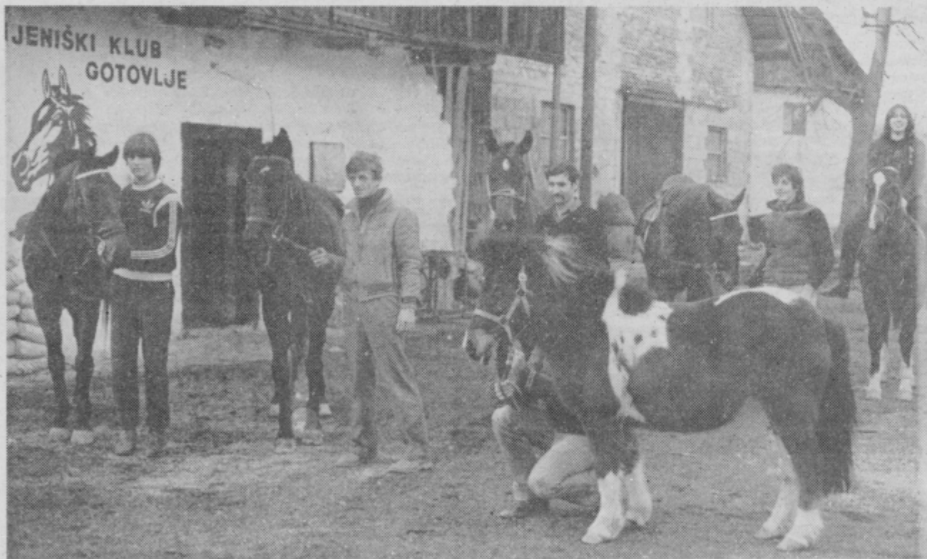
Letos bodo pozornost namenjali tudi turistični ježi.