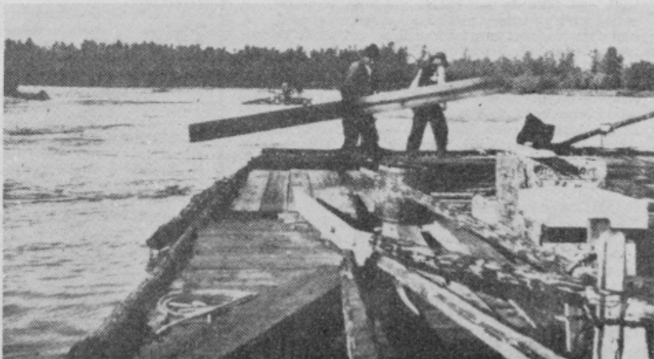
Proti Rugvici so pričeli delati kolibo (trideseta leta)

Neposredneje. Če je eno od znamenj družbenih razmer, ki se hitreje spreminjajo, to, da dosegajo mladi ljudje v omenjenih razmerah pogosto pomembna mesta, medtem ko gre v drugačnih družbenih razmerah, t.j. v takšnih, ki se počasneje spreminjajo, ali v t.i. stacionarnih družbenih razmerah, zaupanje predvsem starejšim ljudem, potlej je sodilo v tem pogledu življenje na splavarskih vožnjah v hitreje se spreminjajoče razmere. Krmanjiži, ki je bilo v njihovih rokah od Rugvice naprej vodstvo vožnje in so jim bili glede tega podrejeni tudi gospodarji ali lastniki, so bili deloma stari okoli 20 let, zvečine pa so napredovali na to mesto potem, ko so odslužili vojake, t.j. ko so bili le nekaj starejši. V domačih krajih bi tolikanj mladi ljudje v tisti dobi praviloma ne mogli zavzemati enako pomembnega mesta.