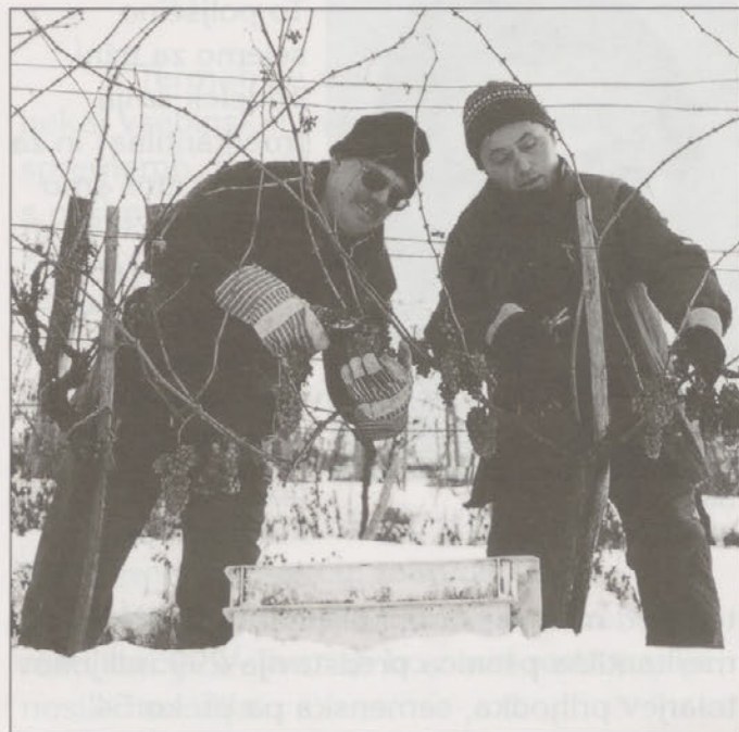
Ledena trgateg na Dravinjskem vrhu

"V laboratoriju SGH vsako leto konec avgusta začnemo spremljati dozorevanje grozdja po posameznih sortah in parcelah. Glede na optimalno razmerje med doseženimi sladkornimi stopnjami in vsebnostjo kislin določimo datum trgatve za posamezno parcelo in sorto, ki je po uradno določenem datumu trgatve za posamezne sorte. V začetku septembra so bile meritve za vse sorte zelo obetavne. Prekašale so celo sladkorne stopnje predhodnega letnika in je veljal za izredno kakovostnega, obenem pa tudi obilnega. Rane sorte (rizvanec, muškati tonel) in srednje pozne sorte (beli pinot, sauvignon) so dosegle vrhunske sladkorne