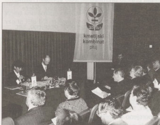
Prvo zasedanje skupščine delničarjev

Delniška družba je tako preživela prvi ognjeni krst svojih lastnikov. Na skupščini je dobila svoje prve stalne organe in tako sta se začasna uprava in začasni nadzorni svet poslovila in zaključila nekakšno prehodno obdobje nastajanja kapitalske družbe.