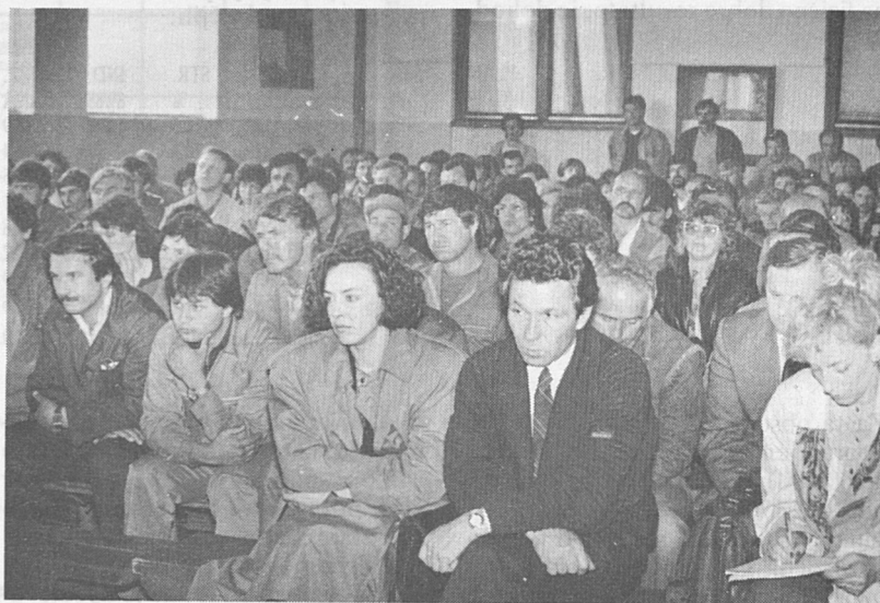
Luški delavci so z velikim zanimanjem spremljali Kučanov nastop.

tem, v kar sem prej verjel; nato sem si ustvaril položaj, da sem lahko to, kar sem mislil, tudi povedal; potem je prišlo četrto obdobje, ko sem lahko vplival na odločitve. Štiri leta na koncu so bila neposredno povezana z močjo, odločitve so bile v veliki meri odvisne od mene in to je bilo najtežje obdobje. Ne zato, ker se je bilo treba odločati, ampak zato, ker sem se ves čas zavedal, da te odločitve nimajo posledic samo zame, ampak najprej za vse moje sodelavce, potem tudi za to veliko stvar, ki se ji zdaj reče slovenski narod."