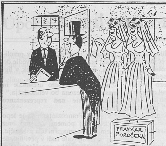
- Dvojčici sta, pa se mi je zdelo škoda, ...