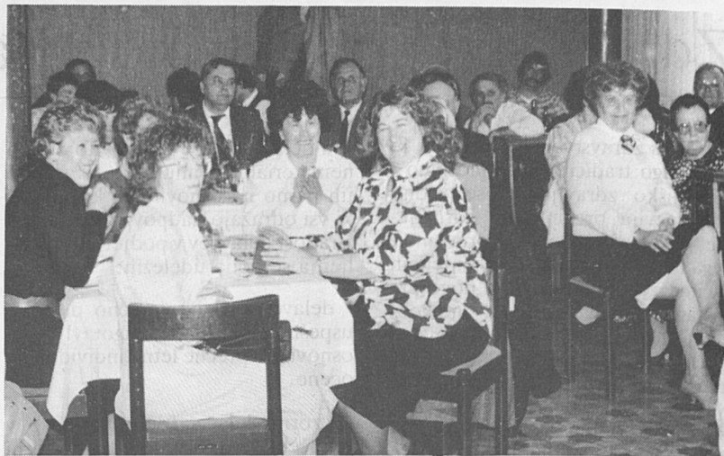
Krvodajalci ob sprejemu v hotelu Triglav

Umrl je luški upokojenec Mile Danev, rojen 3. septembra 1932. leta. V luki Koper se je zaposlil v letu 1975 in v njej delal do 31. maja 1987, ko je bil invalidsko upokojen. Pred upokojitvijo je opravljal delo vzdrževalca v skladišču orodja in zaščitnih sredstev v sektorju Tovari lesa. Nenadna smrt je presenetila številne Niletove prijatelje v okolju, v katerem je delal in živel, potem ko je pred tridesetimi leti zapustil rodni kraj v Makedoniji. Na zadnjo pot smo ga pospremili 20. marca 1990. Slava mu.