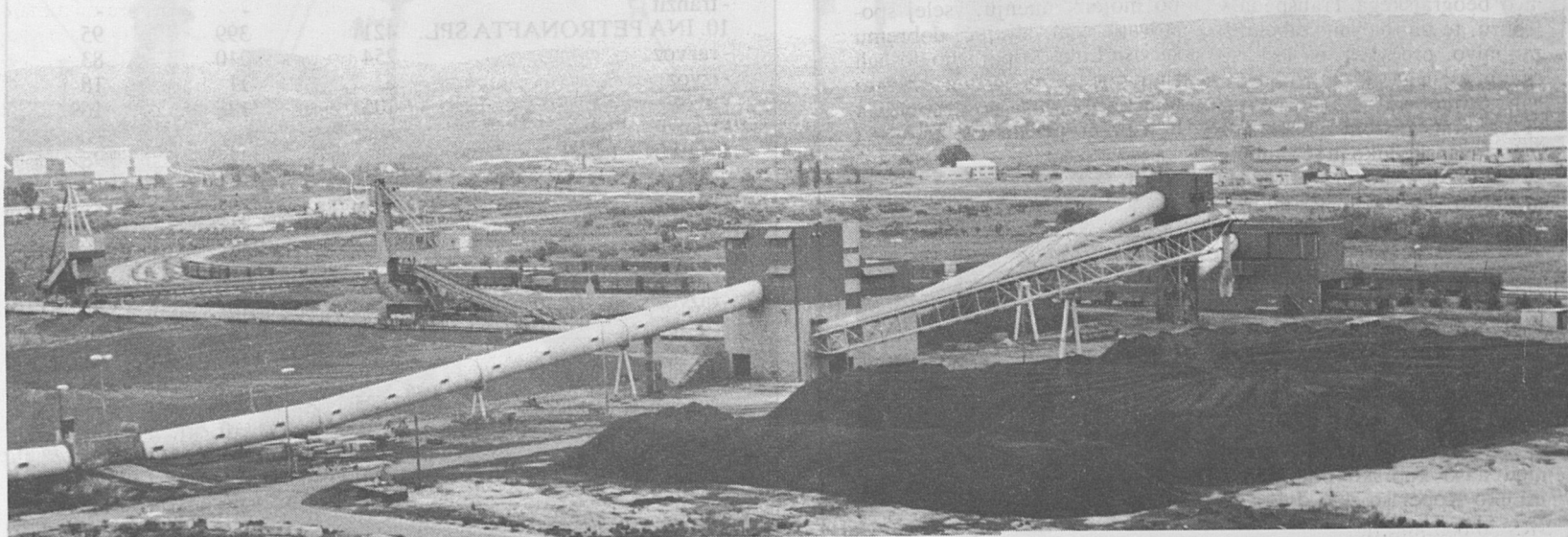
Terminal za razsute tovore