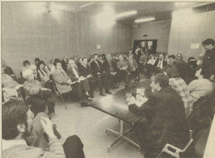
Na razpravo o fojbah se je izzvalo veliko ljudi