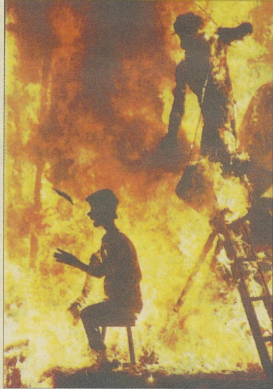
VALENCIA - Za Jozefovo so v spanski Valenciji priredili že tradicionalno fiesto »Las Fallos« na katerem zažigajo lesene lutke v cast sv. Jozefu, zavetniku mizarjev.