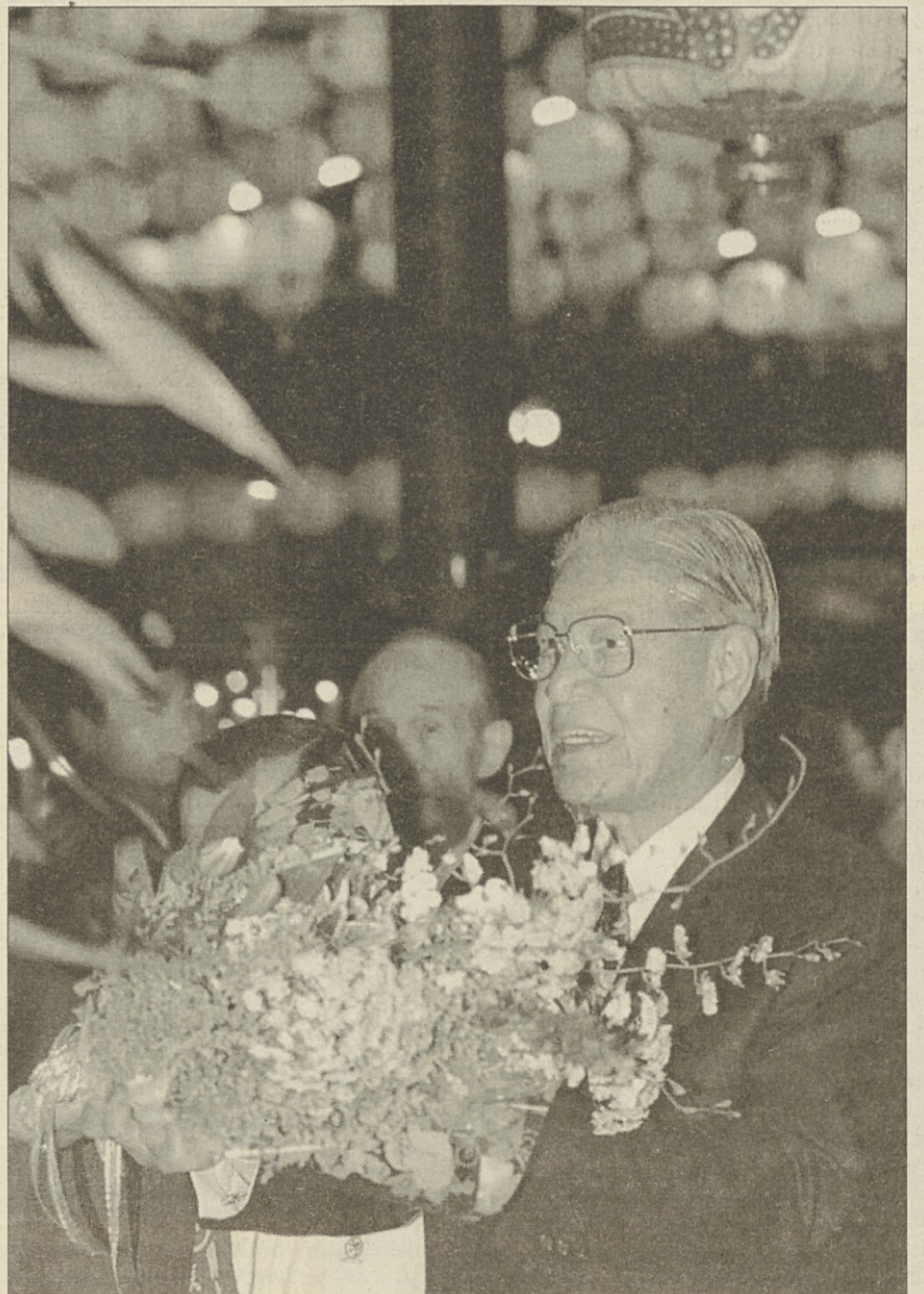
Vodilni predsedniški kandidat Li Teng Hui je bogove prosil za zmago in mir

Tajvanski opozicijski kandidat Peng Ming Min pa je Peking ocital »agresijo« in »gole ozemelske težnje«. Peng Ming Min, najbolj znani tajvanski oporečnik, ki se je na otok vrnil sele leta 1992, je kandidat tajvanske Stranke napredka, ki zahteva popolno neodvisnost od Kitajske. Dejal je, da je Tajvan de facto že dolgo neodvisen in da zato želi ohraniti le status quo. Po zadnjih javnomnenskih raziskavah naj bi na predsedniških volitvah dobil približno deset odstotkov glasov, medtem ko lahko sedanji predsednik Li Teng Hui računa s 30 do 40 odstotki glasov.