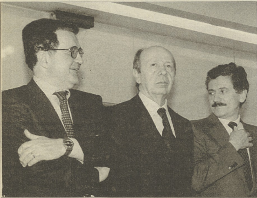
Prodi, Dini in D'Alema (z leve) med včerajšnjo tiskovno konferenco Oljke

Premier Dini označil Berlusconijev program kot »pesek v oči«