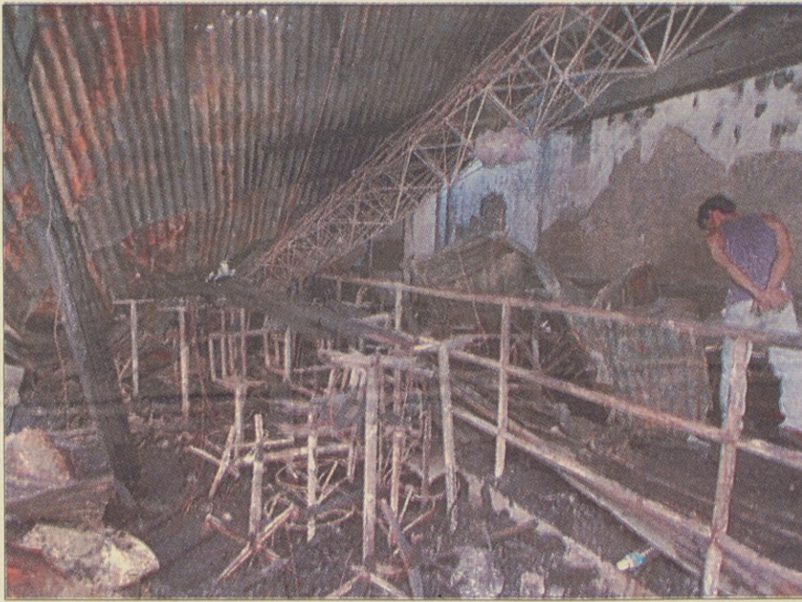
Požar je diskoteko Ozone spremenil v kup zогlenelih ruševi

Po prvih ugotovitvah je požar izbruhnil v kabini disc-jockeyja zaradi kratkega stika, ki ga je povzročila prevelika električna obremenitev aparatur na zastarelo električno napeljavo. Iskre so vnele akustično izolacijo, ki pa ni bila negorljiva, kot to zahtevajo predpisi. Plameni so se torej razširili z nezaslišano hitrostjo, tako da se je zaradi