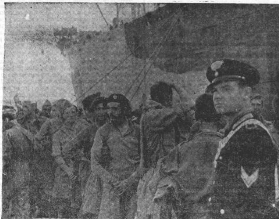
Izkrcanje angleških ujetnikov v nekem pristanišču Južne Italije