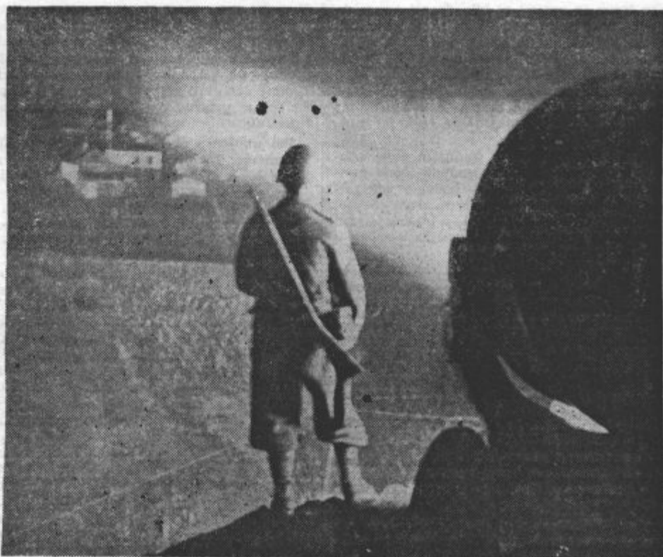
Italijanski žaromet v akciji na Donu, da prepreči sovražnikova presenečenja

Iz Tirane poročajo: Močan potres je pred dnevi prizadel mesto Piškopejo, sedež prefekture v severni Albaniji. Potresni sunek je trajal nekoliko sekund in so ga zabeležili v Tirani in v drugih albanskih mestih. Po prvih poročilih, ki jih je prejelo notranje ministrstvo, je 80 odstotkov vseh hiš v Piškopeji poškodovano. Vas Macelare in nekatera druga sela so takisto močno porušena. Že iz prvih vesti izhaja, da je bilo precej smrtnih žrtev in ranjencev. Albanska vlada je takoj poslala pomoč v prizadete kraje. Tudi fašistična stranka, poveljstvo Milice, Rdeči križ in glavno ravnateljstvo javnega zdravstva so takoj storili potrebne ukrepe za pomoč prizadetim. V potresno ozemlje so bila odposlana živila, sanitetne potrebščine in šotori. Duce je dovolil podporo enega milijona lir prizadetemu prebivalstvu.