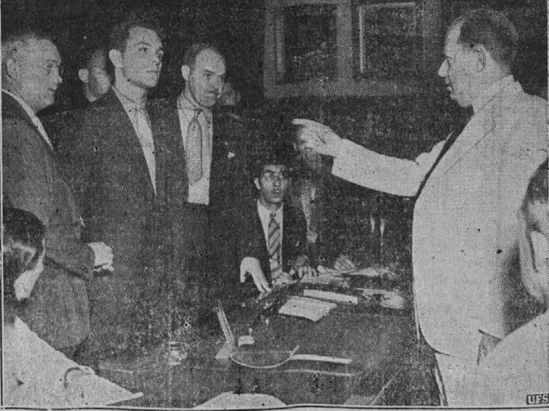
Med filadelfskim županom Wilsonom, ki ga predstojča slika kaže v uradu, ko govori, in pennsylvanski guvernerjem Earleem je prišlo do resnega spora, ko se je pri stavkovnih izredih župan postavil na stran delavcev, guverner pa na stran družb. Miličniki so spojili telefonsko vez in prisilili župana na pogovor. Enega izmed teh je mestna policija aretirala in župan mu daje lekcije. Ob enem je napovedal, da iz teh vzrokov bo on prihodnji politikandiat proti guvernerju Earlu.