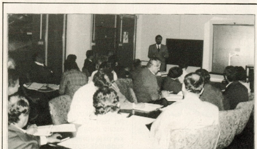
V petek in soboto 20. in 21. maja je potekal seminar za presojevalce stanja pri ozvajanju notranjega ocenjevanja izpolnjevanja predpisov, ki zadevajo različna področja kakovosti.