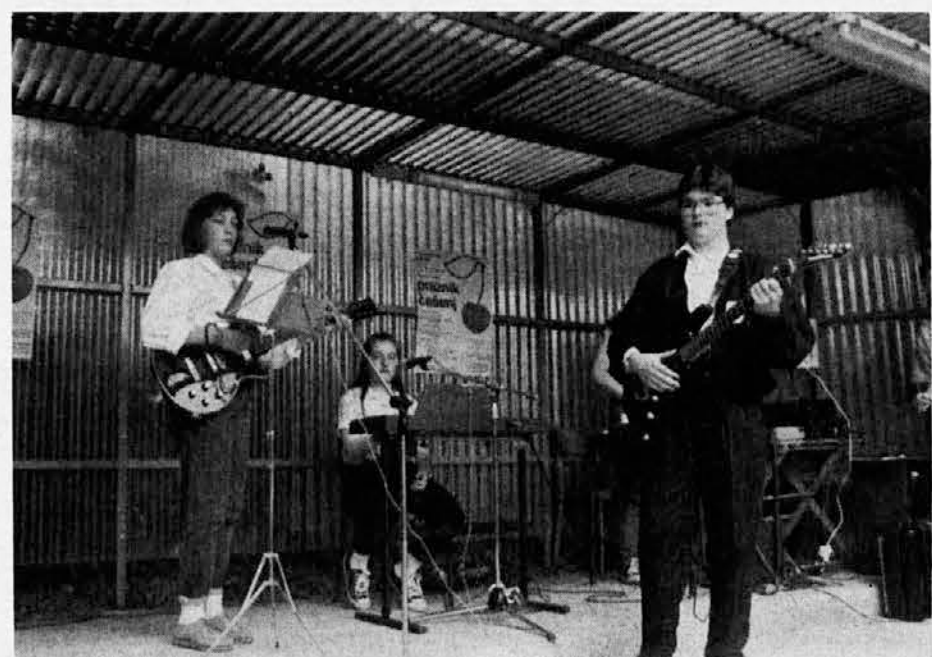
Ansambel župnijske glasbene šole iz Mačkolj ob nastopu na letošnjem Prazniku česenj 28. maja