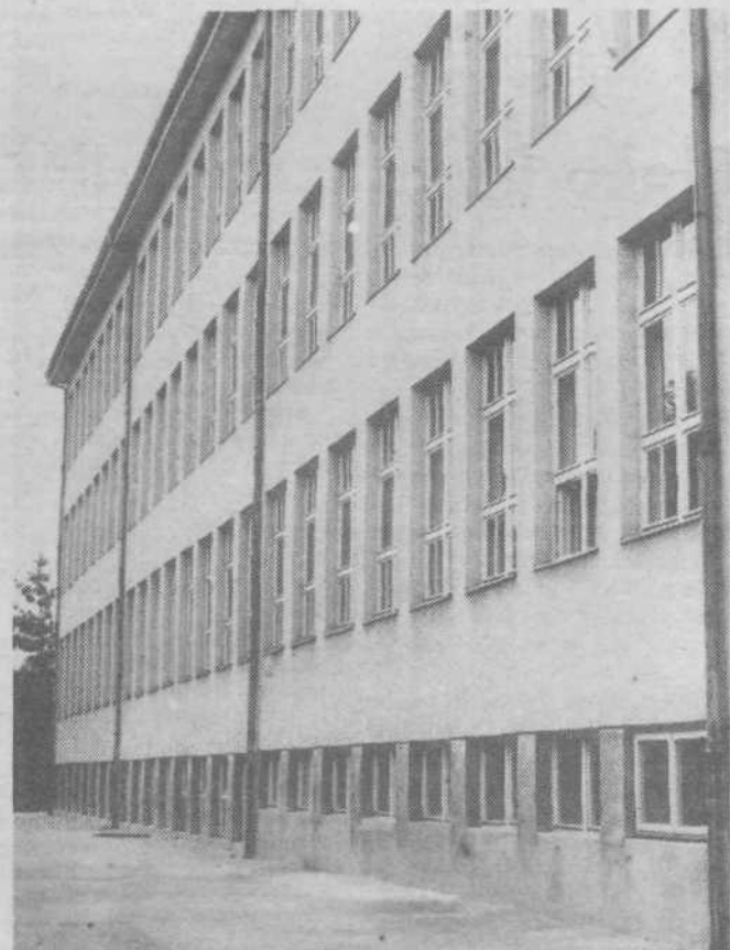
Nova, sodobna popolna osnovna šola v Polju

Kandidati naj svoje prijave z dokazili o izobrazbi pošljejo na naslov: Kulturni dom Španski borci, Zaloška 61, Ljubljana, v 15 dneh po objavi. Stanovanj ni!