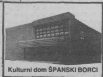
Kulturni dom ŠPANSKI BORCI

V kulturnem domu Španski borci je godba milice 8. novembra privedla koncert skladb Bojana Adamiča za pihalni orkester. Orkester je vodil avtor, spored pa je povezoval Vili Vodopivec. Na sliki: Godba milice na eni zadnjih slovesnosti v Dražgošah