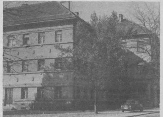
Stara, že nadzidana osnovna šola v Polju.

Tovariš ravnatelj, prosimo vas, da nam poveste kaj več o naši šoli, ki je med največjimi v Sloveniji.