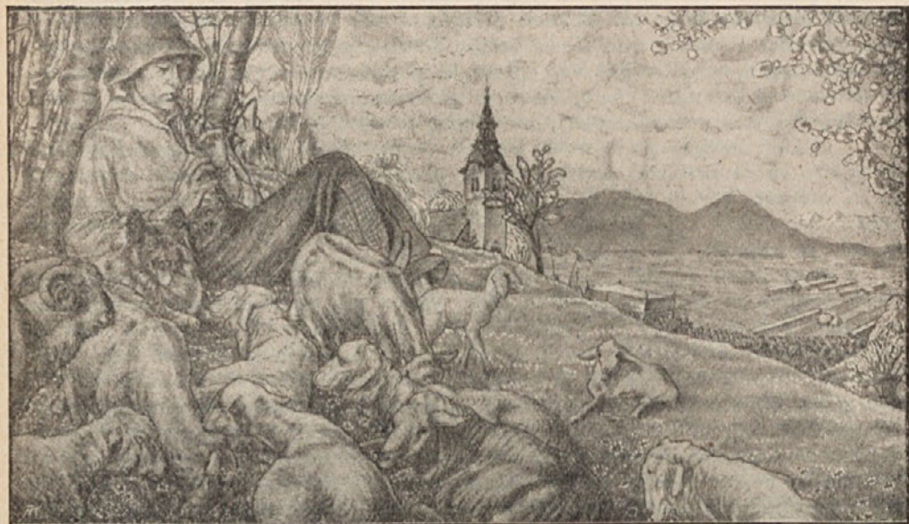
Poglej, obrni se okrog, zelena gora, živ je log; povsodi pomladanski cvet veseljni v svate vabi svet.

ljeni golob svoj aja tutuj; skozi vrhove visokih smrek pa so silili solnčni žarki in osvetljevali v dolgih pramenih debla in mahovita tla. Prav tedaj je gonil Gričnikov Peter dvoje ovc po cesti skozi gozd na sejem. Mudilo se mu je, zato je priganjal ovci z jezo, vlačil za volno in jih neusmiljeno pretepaj z debelo leskovko. Pri Hrastnikovem križu, ki je sameval v sedlu med Hrastnikovim vrhom in Rečnikovo sečo, jo je zavil navzdol mimo Hrastnika po brdu, ki se je polagoma izgubljalo v ozki dolini, po kateri je šla lična cesta tik žuborečega potoka. Svet je postajal rodovitnejši in prijaznejši, gozdovi so se umikali njivam in travnikom, raztezajočim se po pobočju in dolini, ki se je ob koncu nenadoma razširila ter izginila pri Ravnjaku v povprečno Legensko dolino. Ravnjakovo domovje je bila vas zase: velika, enonadstropna hiša je stala tostran ceste nekako osamljena; spodnji prostori so bili odločeni za pивce, zgornji pa za stanovanja in prenočišča. Okraj ceste so stali skoro