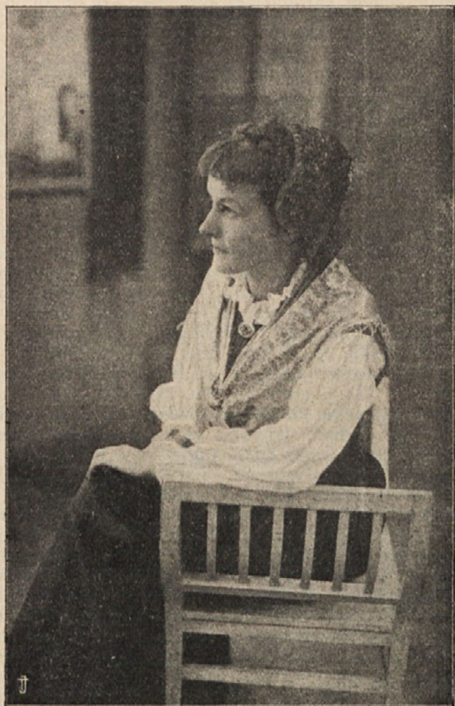
Ženska narodna noša v Meziški dolini.

Moški so nosili v starih časih dolge lase, ki so segali do ramen. O Veliki noči so jih prirezali, kakor sedaj gosposkične po mestih, ki nosijo