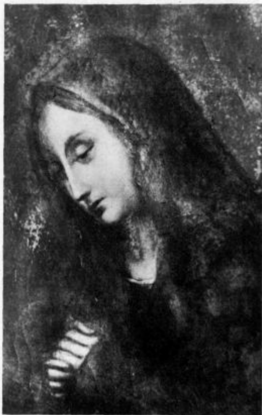
Marijina podoba, ki jo je pokojni škof A. M. Slomšek posebno častil.

Potem se z desne, leve zgor jasnilo je nekaj belega; in belo progo oko tud spod je kmalu zapazilo.