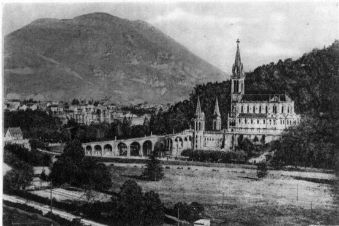
Pogled na lurška svetišča. Spredaj reka Gave, v ozadju Pic du Jer.