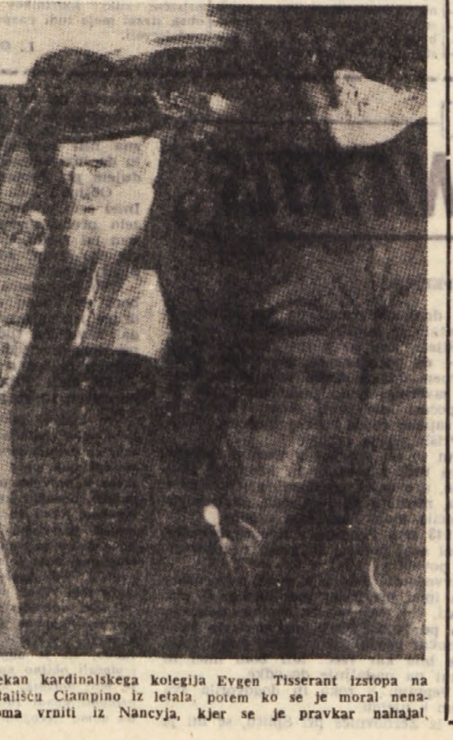
Dekan kardinalskega kolegija Evgen Tisserant izstopa na letališču Ciampino iz letala, potem ko se je moral namodoma vrniti iz Nancyja, kjer se je pravkar nahajal.