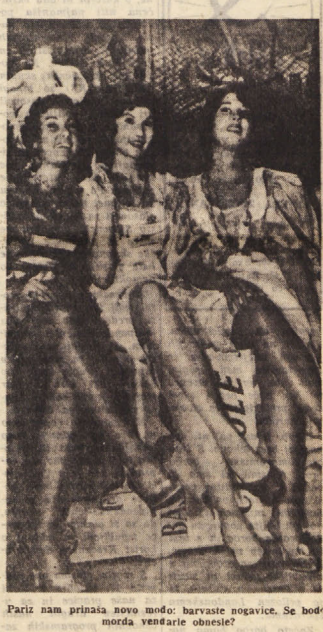
Pariz nam prinaša novo modo: barvaste nogavice. Se bodo morda vendarie obnesle?

Gobe lahko vložimo v kis: za to izberemo mlade, zdrave in nepoškodovane gobe, po možnosti jurčke, ki jih dobro operemo v mrzli vodi. Nato jih skuhamo v dobro zasoljeni vodi in jih nato stresemo v rešeto, da se odcedijo. Hkrati ko kuhamo gobe, zavremo v vrtni kis, kateremu smo dodale še kako dlavo. V vreli kis damo ocejene gobe, da se sarkrat prevro, nakar jih odstavimo od ognja. Popolnoma ohlajene vložimo v steklene kozarce in jih zalijemo s kisom, ki mora pokrivati gobe za prst visoko. Ne bo odveč, če bomo na vrh dolile še plast dobrega olja. Zelo priporočljivo je, da so gobe drobne. Gobe vlagamo tudi v sol: Najprimerneje so spet mlade, še trde gobe, ki jih najprej dobro očistimo in ostrgamo ter obrisemo. Ne smemo pa jih prati. Nato jih zrežemo na tanke rezine in z njimi polnimo popolnoma suhe kozarce v plasteh. Najprej potresemo plast soli, nato plast gob in tako vse do vrha, nato jih nekoliko potlačimo, da zbitostimo iz kozarca biti seveda. Zadnja plast mora biti seveda plast soli. Kozarce nato neprodušno zapremo in hranimo na temnem in suhem prostoru. S takimi gobami ravnamo nato kot s suhim, le da pri pravljanju hrane ostalih dodatkov ne solimo, ker so že gobe same močno slane. Če za določeno je potrebujemo veliko gob, jih bomo pred uporabo namočili v mrzli vodi, da jim voda odvzame sol.