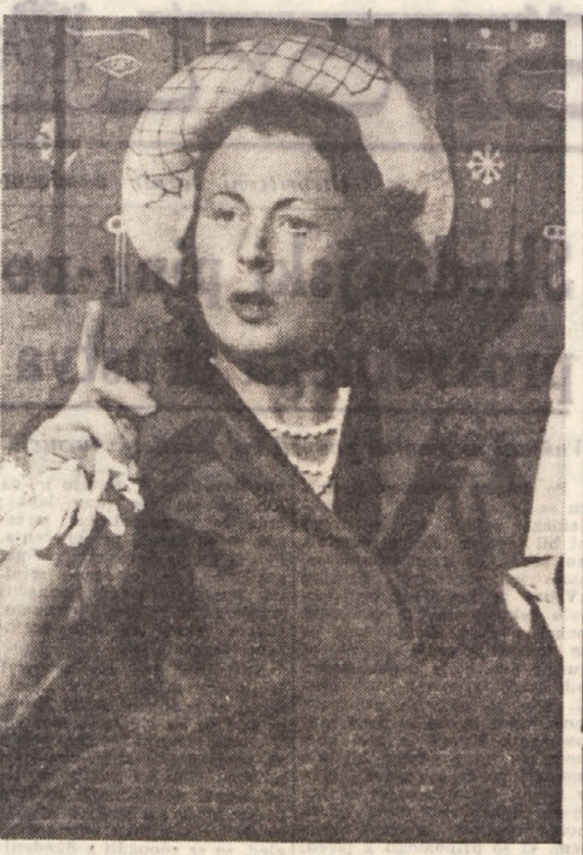
BARBARA CASTLE od prejšnjega tedna nova predsednica angleške laburistične stranke. Energična poslanka je bila v zadnjem času večkrat omenjena v mednarodni kroniki zaradi hudega obtožb proti tistim angleškim državljanom, ki spodbujajo angleške čete na Cipru k nasilju nad ciprskimi patrioti.