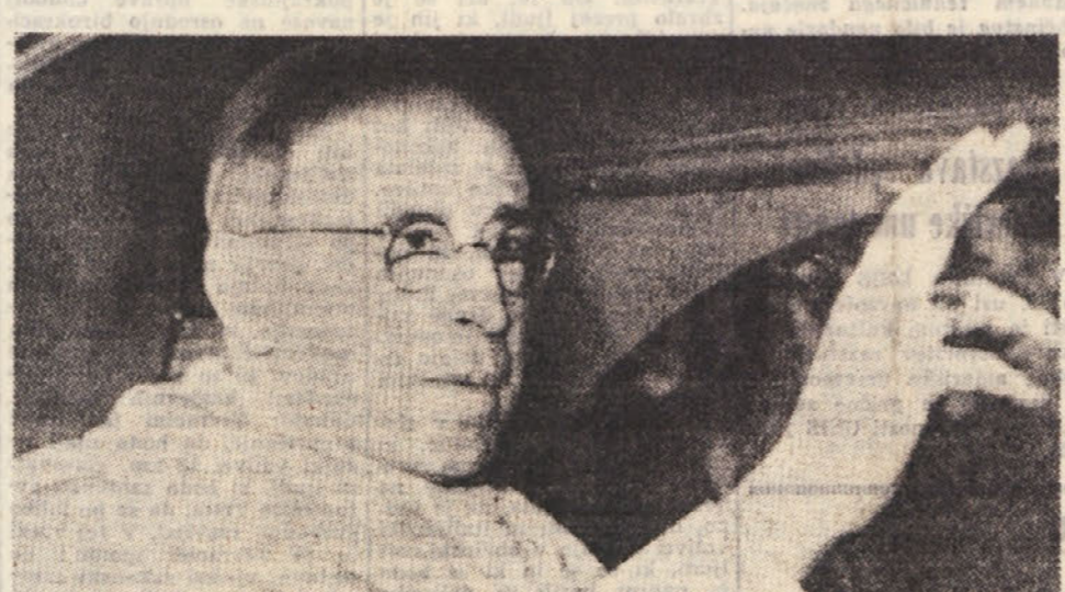
Slučajno odprto okno v Castelgandolfu vzrok neresnične vesti o smrti Pija XII

CASTELGANDOLFO, 8. - Nekoliko pred poldnevom so uradno sporočili, da je papež Pij XII. začel umirati. Vsi dan so od časa do časa objavljali zdravniška poročila, ki so kazala, da se njegovo stanje vidno slabša. Ob 22.30 je pater Pellegriano sporočil zadnje podatke, ki so mu jih dali zdravniki: »Zdravniki potrjujejo, da se stanje vedno bolj slabša. Mrzlica, ki je delila z merna, je sedaj naravnala nad 40 stopinj. Dihanje je pogostoma hropeče. Pulz 140, pritisk začena padati. Predstava se, da bo ponoči nastal kolaps. Zdravniki pravijo tudi, da se sedaj lahko z gotovostjo reče, da je prognoza neugodna. Vse potrebne zdravljenje je bilo izvedeno.