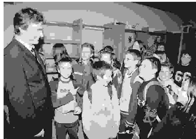
Minister dr. Milan Zver med tolarji v Sloveniji

Ko mu izrekamo dobrodoščilo izražamo upanje, da bo dialog iskren in konstruktiven in sadovi obiska bogati za Slovenijo doma in po svetu.