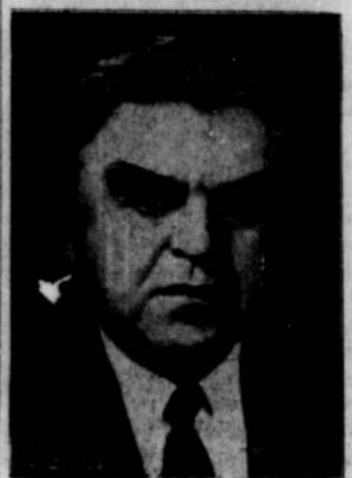
JOHN L. LEWIS

Kakor govorniki na konvenciji CIO v Atlantic Cityju, tako so tudi predstavniki AFL na konvenciji v New Orleansu za trjevali, da so za slogo in za združenje obeh skupin. A za enotnost je treba premostiti vzroke razdruženja in teh se AFL