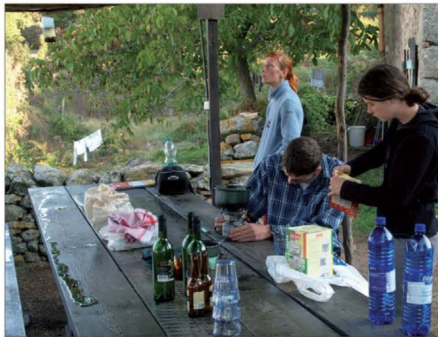
Zajtrk, pa čeprav nenavaden - instant mineštra - nam ni bil usojen, saj je v gorniku zmanjkalo plina