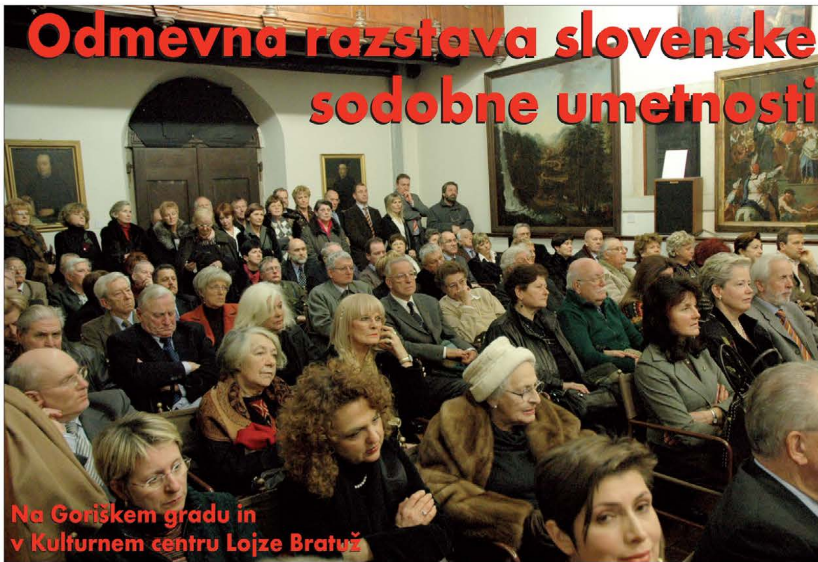
Na Goriškem gradu in v Kulturnem centru Lojze Bratuž

Benedetto Croce je zapisal, da bi morala biti zgodovina nekakšno veliko kasacijsko sodišče, ki bi ponovno pregledalo razsodbe, ki so jih izrekle človeške strasti in zmote. Samo tako bi kot v nekakšni vesoljni sodbi razlikovala dobro in zlo.