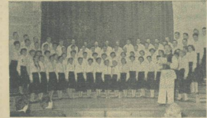
Naš APZ med gostovanjem

Disciplina je pa takšna, kot nikjer drugje! — Profesor Go-