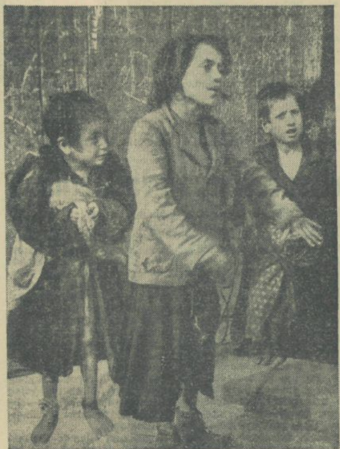
Otroci v španskih predmestjih še vedno živijo v veliki revščini

Kljub temu SEU ni prava študentska organizacija in je po-