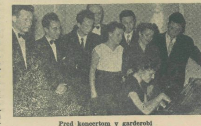
Pred koncertom v garderobi