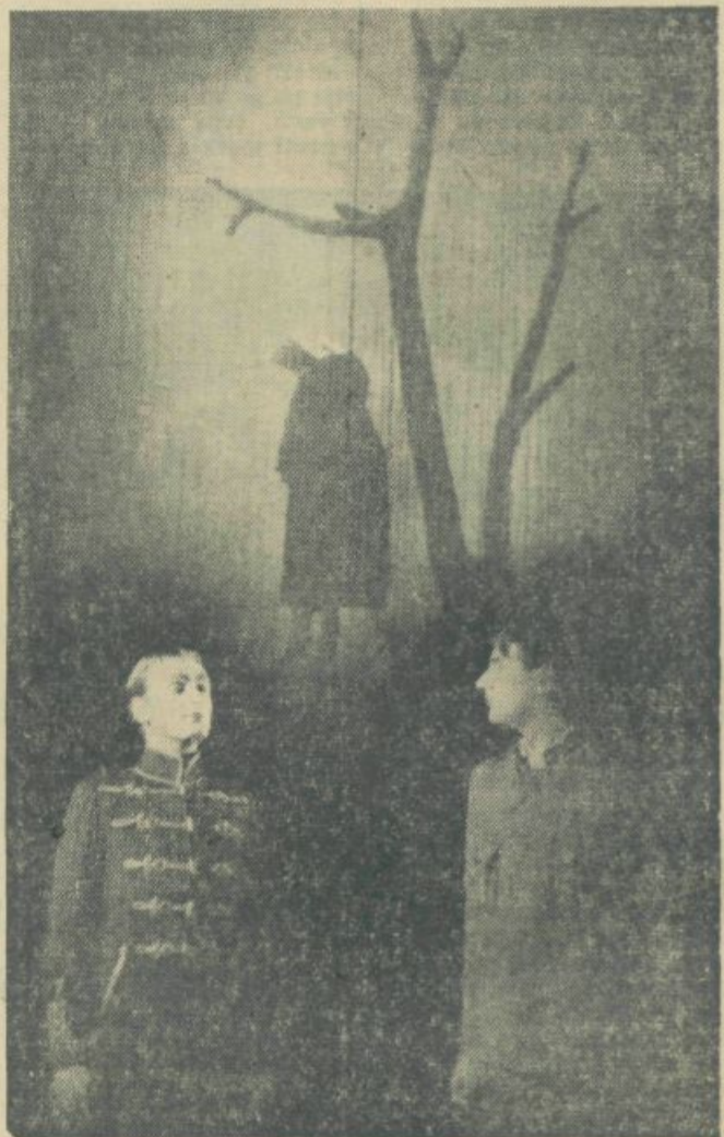
Prizor iz Križevce drame »V taborišču«