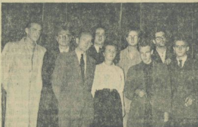
Z literarnega večera