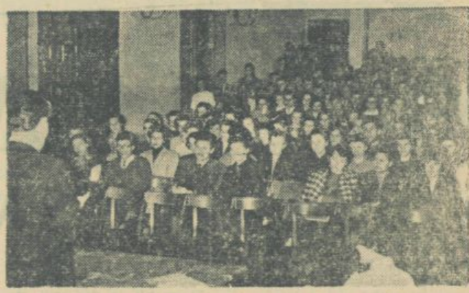
Na literarnem večeru

Ti sporedi Jugoslovanske kinoteke po estetskem in moralnem vrednotenju sicer niso vsi najboljše, vendar pa so vsi resni in imajo resne pretenzije. Zato pomenujemo tudi prepotreben protitež vsakodnevnih smrti, ki nas v običajnih sporedih kur zasipava. AS