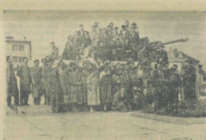
APZ na gostovanju v Murski Soboti