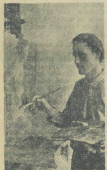
Kljub pomanjkanju dobrih barv...

...navada, da se na naši visoki umetniški šoli, Akademiji za upodabljajočo umetnost, na koncu šolskega leta položi obračun, je že običajna. Vendar — so naši mladi umetniki letos prvič razstavili izven internega kroga šole. Nedvomno: