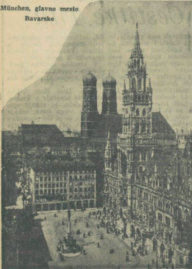
München, glavno mesto Bavarske

Zivljenje študentov v Španiji je izredno težko. To nas nit