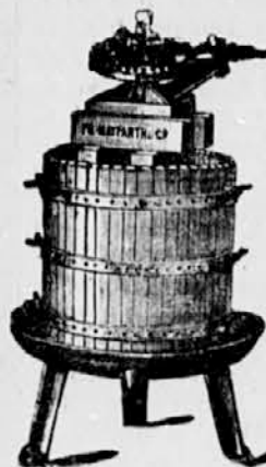
Stiskalnica za vino.

in za MASLINE so stiskalnice „ERCOLE“ najnovejšega in izvrstnega sestava s pristrem za dvostruki in trajni pritisk; z jamčena največa izraba, večja od vseh drug h stiskalnic; najboljše avtomatične žkropilnice za trte patent.