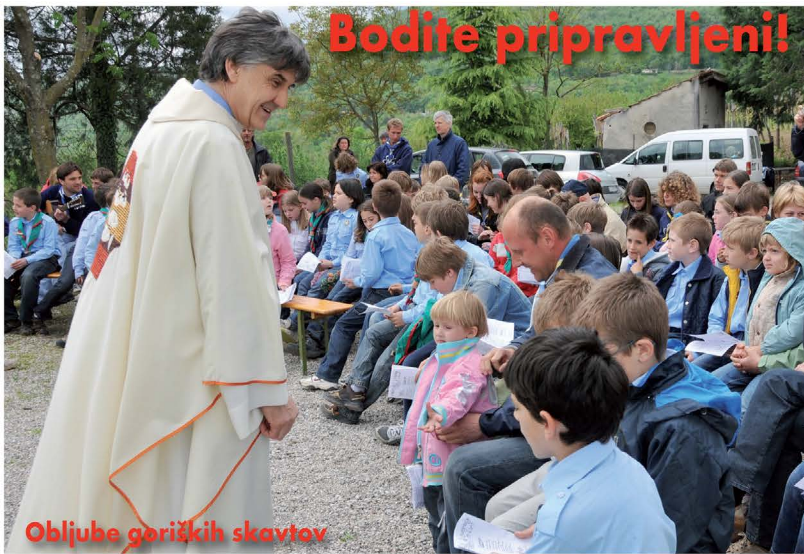
Obljube goriških skavtov

V tem okviru se torej zrcali prava slika praznika osvoboditve. Kot je bila nekoč borba za pravice v znamenju vrednot svobode in demokracije, je torej danes duh 25. aprila še vedno živ za razvoj sodobne družbe. Kot idealno nadaljevanje tega pa je že pred nami 1. maj, mednarodni praznik dela, ki s svojim močnim družbenim nabojem prav tako omogoča in uresničuje resnično socialno svobodo vseh ljudi.