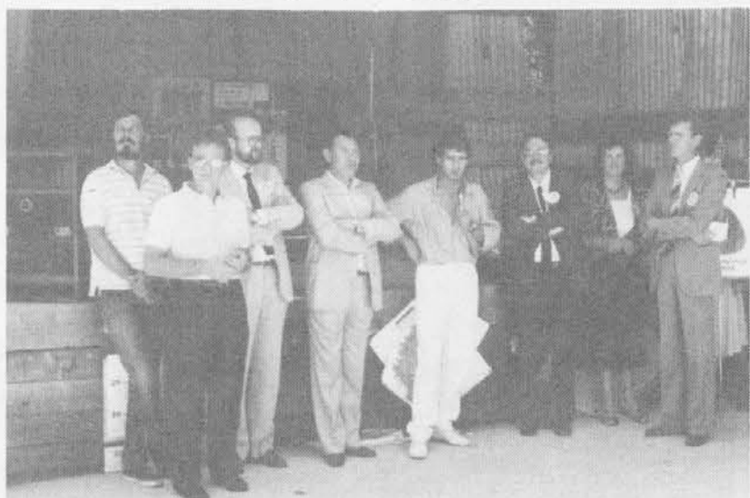
Politični predstavniki na inauguracjonu sekcije za Dreko an Garmak