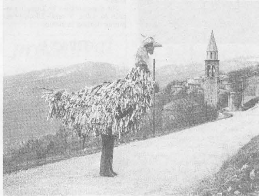
Marsinski petelin. Slika Naska Križnarja iz knjige Maske slovenskih pokrajin istega avtorja