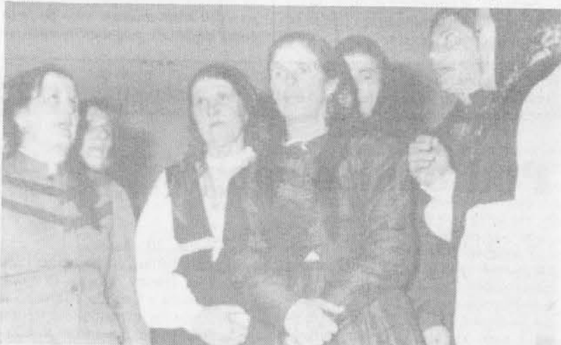
Rezijanke v Kulturnem domu v Trstu leta 1974

Naj ob koncu povemo še, da od 16. do 18. avgusta bo v Osojanah vaški praznik. Tudi ta prireditev ima bogat program, na prvem mestu pa bo kot ponavadi v Reziji ples.