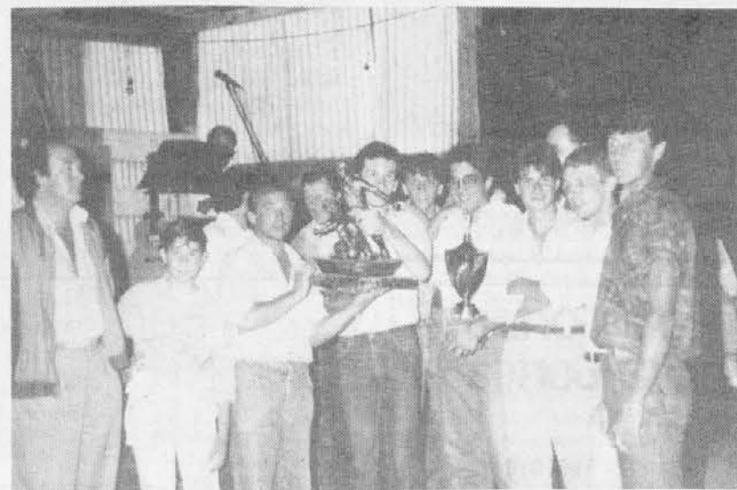
Ekipa, ki je zmagala letošnji turnir