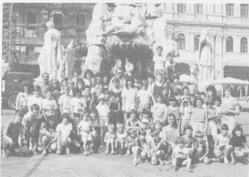
Mlada brieza v središču Trsta

gi e che viene a Mlada brieza per la decima volta di fila. Ha cominciato nel 1977, a Tribil Inferiore e Debeli Rtič: aveva appena 6 anni!