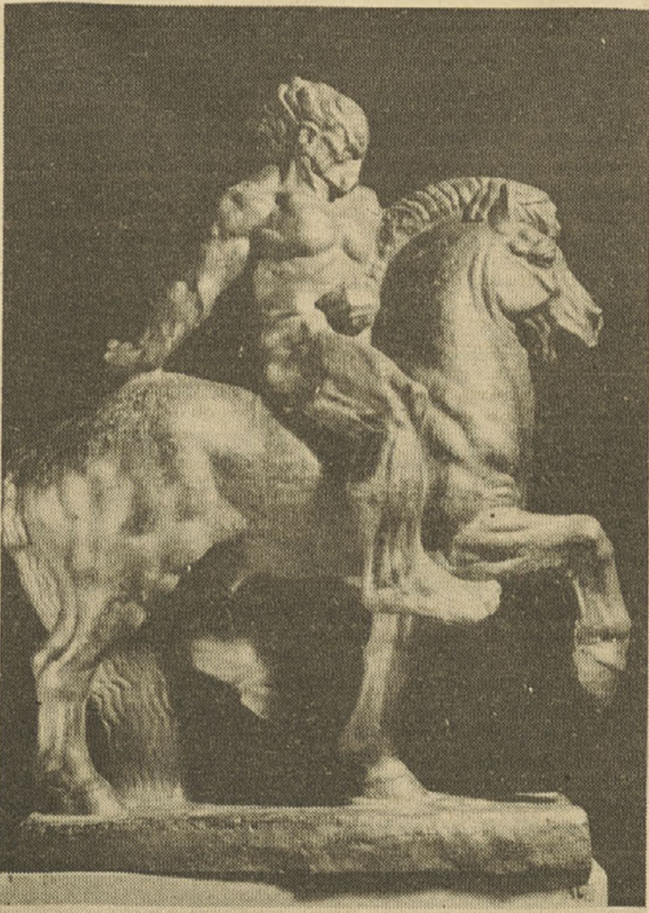
Ivan Meštrović: Kraljevič Marko na konju, bron, 1910

Naglo naraščanje števila osnovnih šol, ki so prehajale v celodnevne osnovne šole, je sprožilo tudi nekatere negativne pojave in opozorilo na nekatere senčne strani intenzivnega in pospešenega razvoja celodnevni osnovnih šol. Zaradi gmotno, organizacijsko in strokovno večjih zahtev celodnevne osnovne šole v primerjavi s tradicionalno osnovno šolo in osnovno šolo s podaljšanim bivanjem je potrebna za prehod na celodnevno delo temeljita gmotna, psihološka in strokovna priprava učiteljev, učencev, njihovih staršev in drugih krajanov ter družbenih