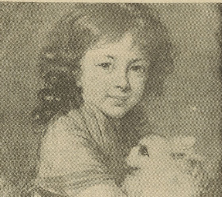
Elizabeth Vitee-Lebrun: Portret Elizabeth Isabelle Mniczech, olje, 1797. Umetnica je bila dvorna slikarka in znana predvsem kot portretistka. S prefinjeno eleganco ohranja slika izjemno raven. Po tej sliki sta naredila poljska umetnika miniaturno kopijo.