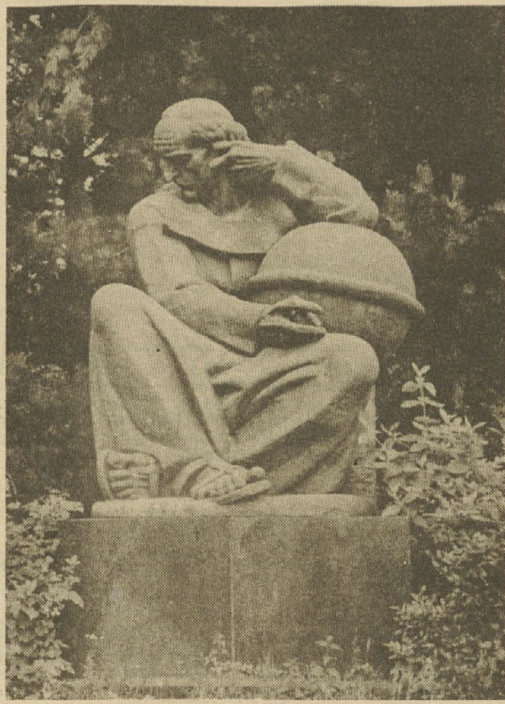
Ivan Mestrovic: Rudjer Bošković, bron, 1937—1956