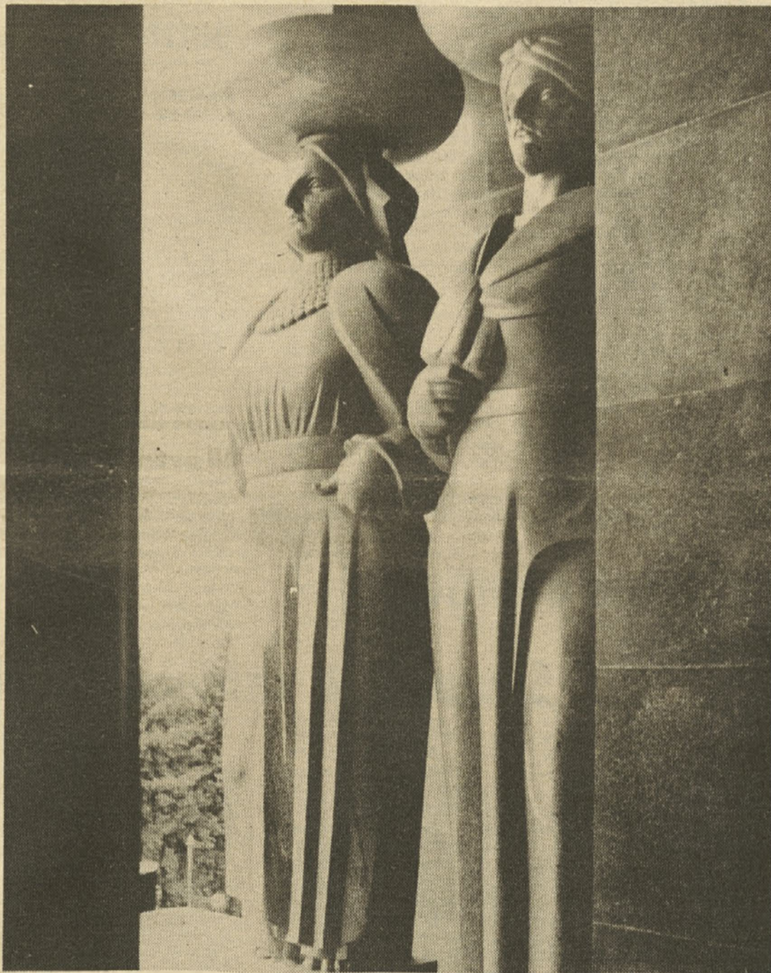
Ivan Meštrović: Spomenik neznanemu junaku, marmor, 1934—1938