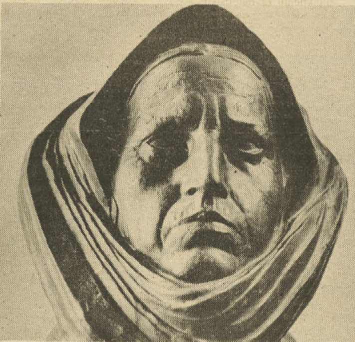
Ivan Meštrovič: Moja mati, bron, 1909

Od ustanovitve pa do danes se je zvrstilo na tej srednji šoli v Ljutomeru že 17 rodov ali skupaj nekaj več kot 900 maturantov. Večina jih je nadaljevala študij