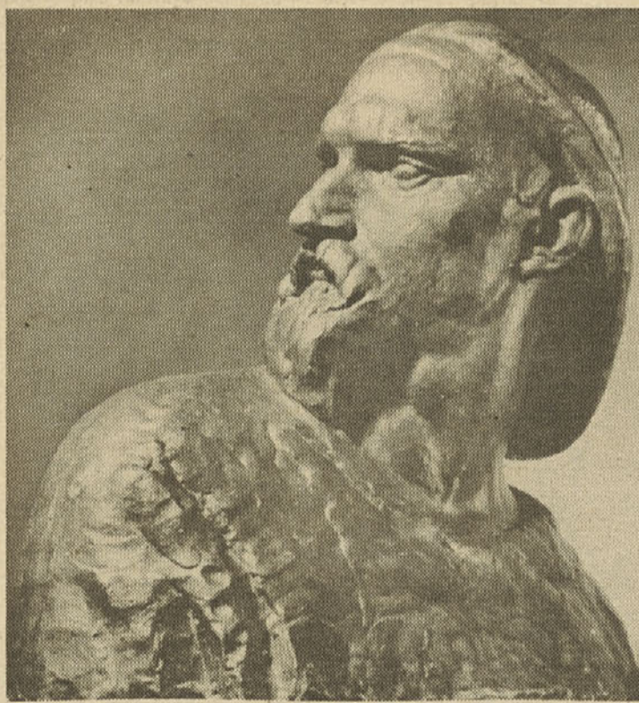
Ivan Meštrović: Avtoportret, bron, 1932