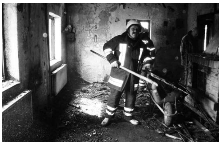
Sanacija prostorov dan po požaru