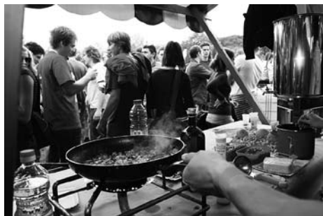
S klubskih stojnic je dišalo še in še.

Škisova tržnica je tudi letos privabila več kot petnajsttisočglavo množico mladih po srcu, duši in letih. Letos je bilo, prvič po nekajletni tradiciji dežja in slabega vremena, spet lepo in toplo vreme, tisto pravo za uživanje ob kozarcu osvežilne pijače in klepetih s starimi znanci, kolegi, prijatelji ter spoznavanje novih ljudi.