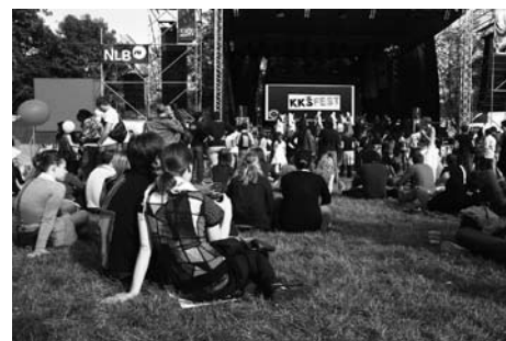
Tudi kulturnega dogajanja na tržnici nikoli ne manjka.

Torej, za uverturo v poletje se vidimo na