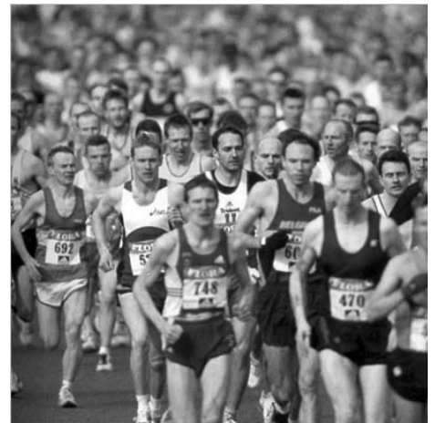
Maraton ni samo tek, ampak tudi druženje.