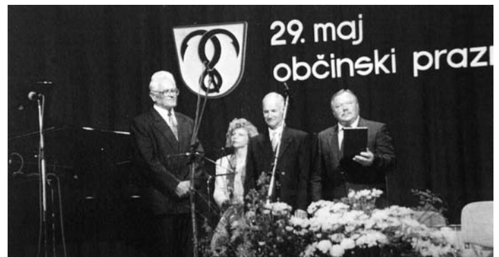
Podelitev zlatega priznanja, 29. maja 1998

Tekst: Branko Lipar