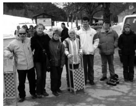
Naši športniki v Avstriji