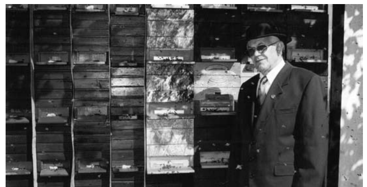
V družbi svojih brenčečih prijateljic