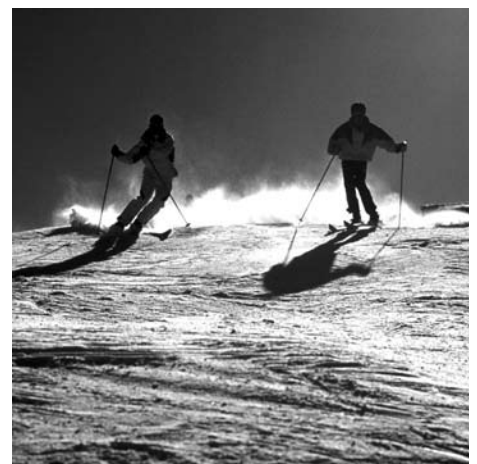
Smučanje je v Sloveniji najbolj priljubljen zimski šport.