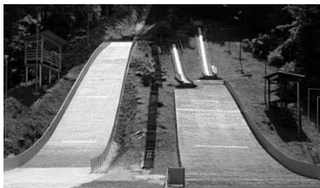
Skakalnica je že skoraj dokončana, manjka le še naletna smučina.

montaža zaletne smučine. In vse to je bilo opravljeno, kljub slabim obetom, da ne bo sredstev za plačilo izdelave plastike. A se je k sreči vse dobro izteklo. Zato zahvala vsem, ki so pripomogli k takemu razpletu. Konec meseca maja, ko Mengeš praznuje svoj občinski praznik, pa bo pod hribom