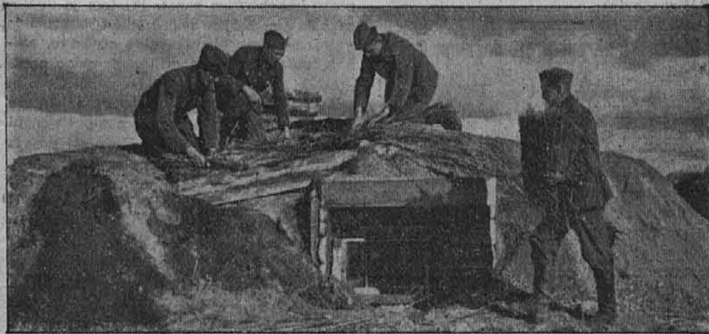
Po državni delavni službi se gradijo strelnice za oboroženo silo. Kadar je strelnica (kladara) gotova, se na koncu pokrije z zemljo in s plastjo slame. Viden je samo še mali vhod. Tudi ob snežnih viharjih bo tukaj notri še toplo.

V času od 26. novembra do 2. decembra so skupine nemškega zračnega brodovja in edinice nemške vojne mornarice sestrelile 44 britanskih letal. V istem času smo v boju zoper Veliko Britanijo izgubili 6 lastnih letal.