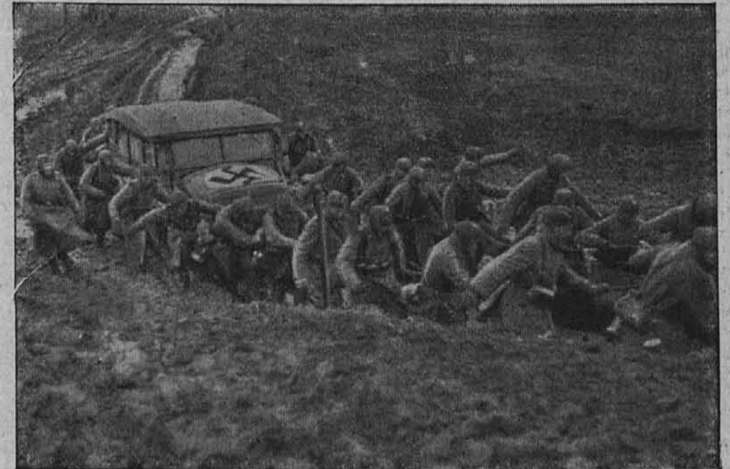
Po sovjetskih cestah

Strelci potegujejo iz blata voz, ki je obtičal.