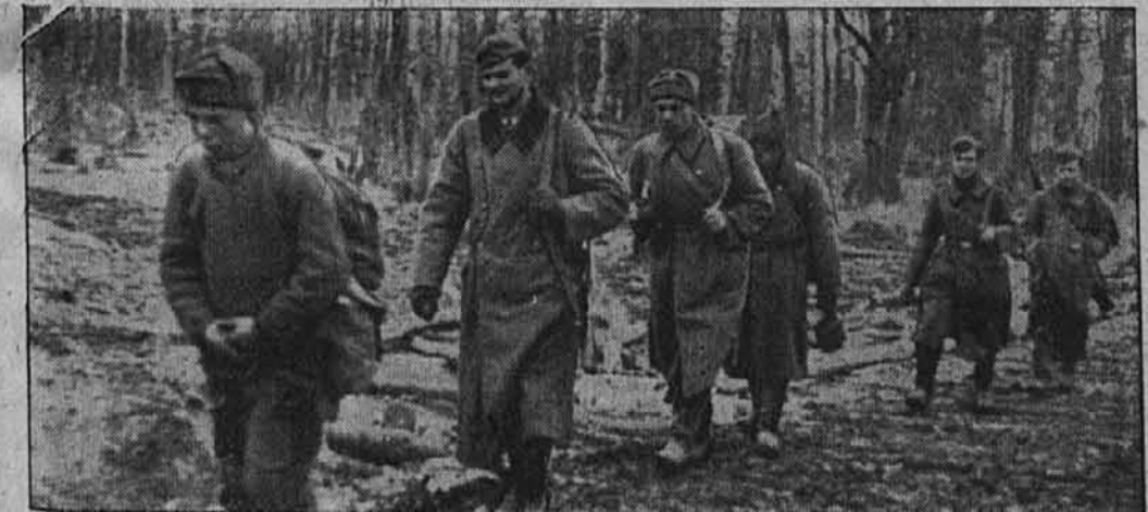
Na vzhodni fronti

Ujeti bolševiki, nastanjeni v zbiralnih taboriščih, se pritegnejo tudi h koristnim delom; tukaj so v sestavi kolone nosilcev.