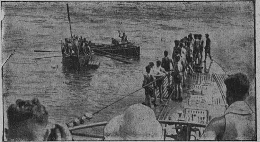
V južnem Atlantiku torpedirana

Ob porodih ali nadlogah zaradi nosečnosti prejema ženske zavarovanke, ki so bile v dveh letih pred porodom najmanj skozi 10 mesecev zavarovane zoper bolezen, pomoč z babico, zdravili in lečili in ako je potrebno (Nadaljevanje na 4. strani.)