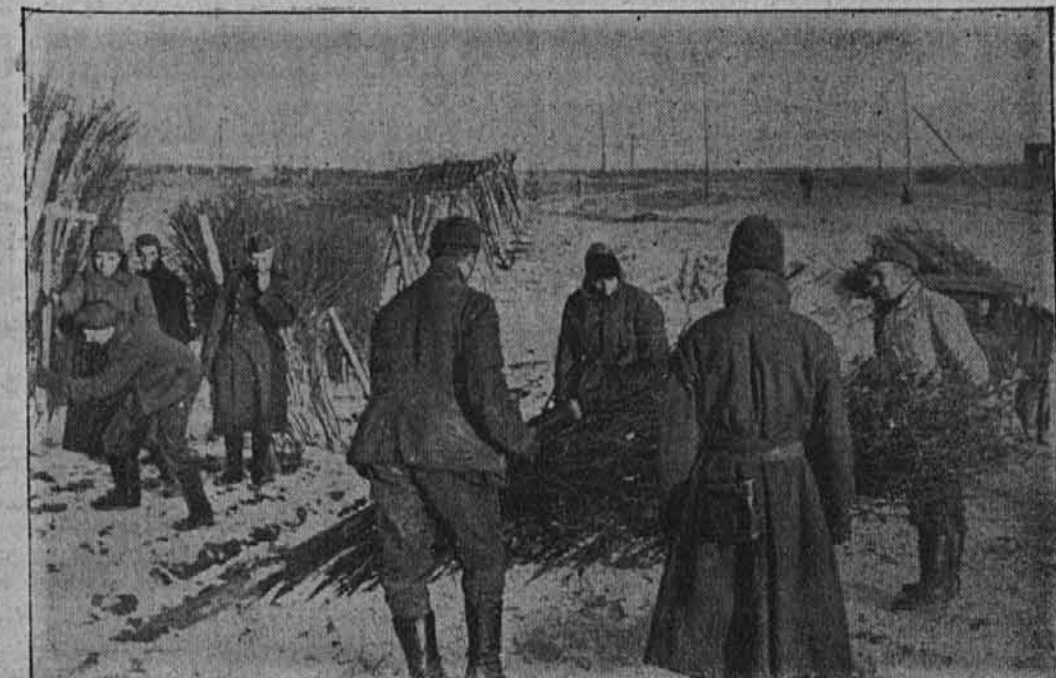
Plote iz spletenega dračja proti snežnim zametom postavlja naš gradbeni bataljon na vzhodu povesod vzdolž glavnih cest.