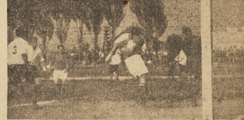
Prizor iz včerajšnje tekme Železničar : Sutjeska