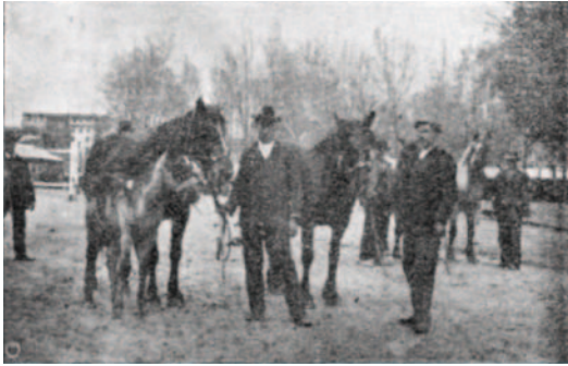
Slika 3: Kobile in žrebe kobariške pasme, (Selan, 1909b) Figure 3: Mares and foal of the Kobarid horse (Selan, 1909b)