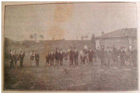
Slika 4: Žrebeta kobariške pasme, (Dve sliki ..., 1927) Figure 4: Foals of the Kobarid horse breed (Dve sliki ..., 1927)

no poročilo o poteku razstave živine v Kobaridu in na razstavo je bilo privedenih 34 žrebet kobariške pasme. O tej razstavi piše tudi Gospodarski list (Dr. M-G.F., 1925), ki je objavil program in pravilnik razstave. Gospodarski list v kratkem sestavku poroča, da je »bila pred vojno po Furlaniji razširjena vrsta konj, ki ni bila zelo nagla, pač pa zelo dobra za delo. Med vojno so skoraj vsi ti konji zginili, kar je bilo tudi umljivo. Po vojni so tu ostali konji številnih pasem, prignanih iz različnih pokrajin bivše Avstro-ogrške, pa tudi iz Rusije, Nemčije, Balkana in od drugod« (Furlanski konji, 1926). V nadaljevanju poroča, da je več glasov, da se mora obnoviti znana kobariška pasma konj, ki je med vojno skoraj izginila in objavljen je razpis ter pravilnik za jesenske razstave mladih bikov belanske in žrebet kobariške pasme.