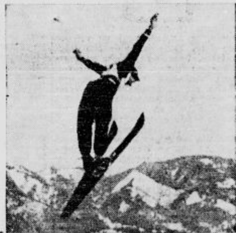
Bradlov skok v Planici.