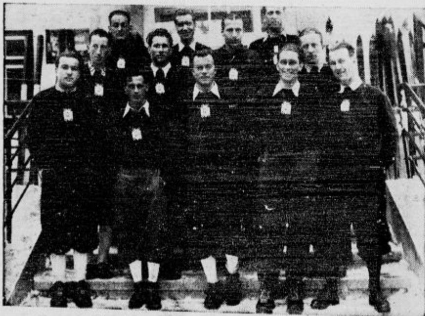
Slovensko smušarsko odposlanstvo v Bad Hofgasteinu.