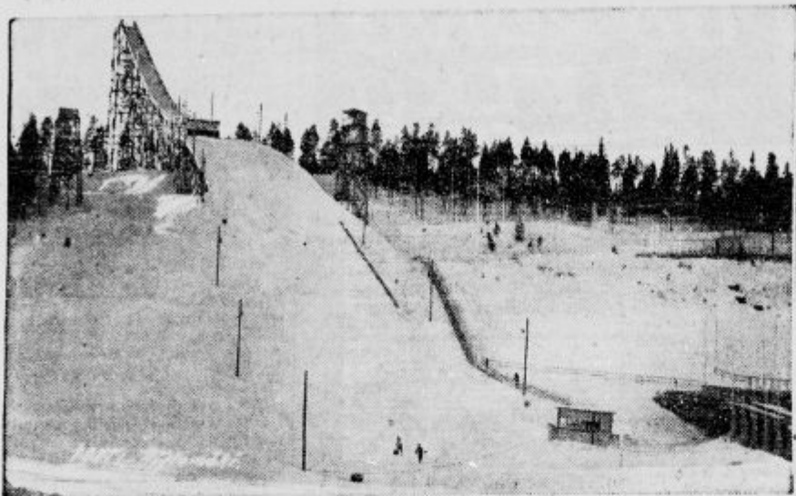
Smuška skakalnica v Lahtiju na Finskem.