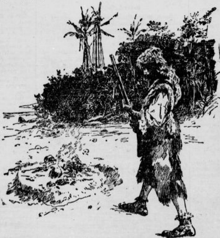
Ves presenečen sem obstal pred strašnim prizorom