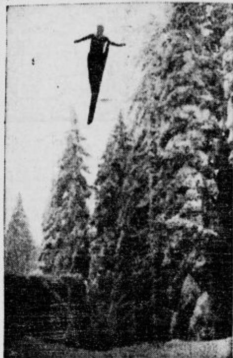
Smušarski skok raz skakalnice v Pokljuki.