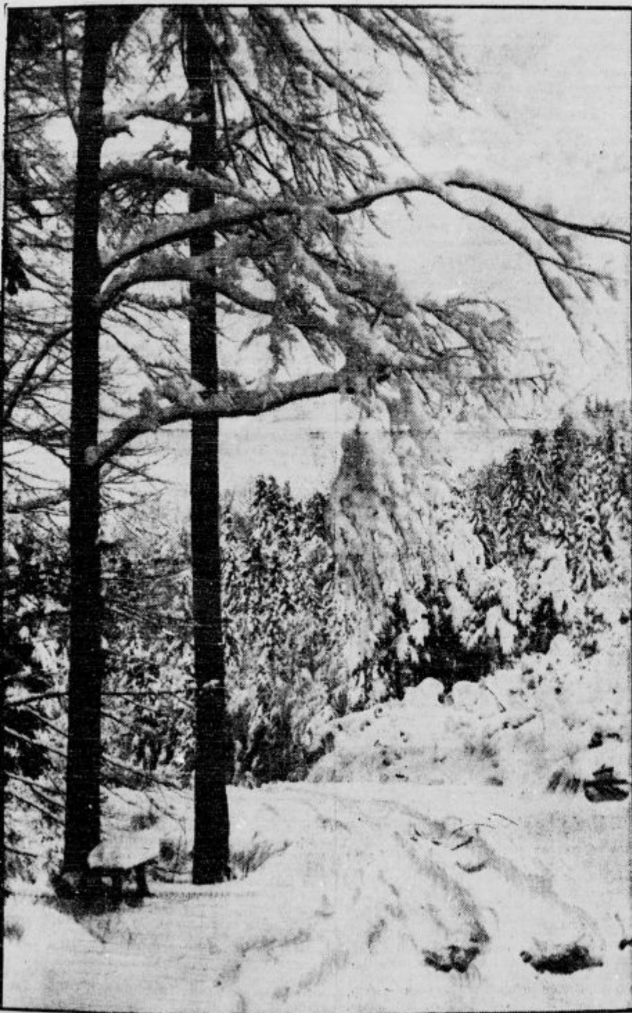
Kadar je zima huda . . .